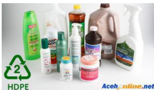
Gambar 2. Plastik yang termasuk dalam jenis HDPE

HDPE merupakan salah satu bahan plastik yang aman untuk digunakan karena kemampuan untuk mencegah reaksi kimia antara kemasan plastik berbahan HDPE dengan makanan/minuman yang dikemasnya. HDPE memiliki sifat bahan yang lebih kuat, keras, buram dan lebih tahan terhadap suhu tinggi jika dibandingkan dengan plastik dengan kode PET. Ada baiknya tidak menggunakan wadah plastik dengan bahan HDPE terus menerus karena walaupun cukup aman tetapi wadah plastik berbahan HDPE akan melepaskan senyawa antimoni trioksida secara terus menerus.