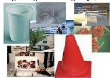
Gambar 5. Plastik yang termasuk dalam jenis Polystyrene

PS biasa dipakai sebagai bahan tempat makan styrofoam, tempat CD, karton tempat telur, dan lain-lain. Selain tempat makanan, styrene juga bisa didapatkan dari asap rokok, asap kendaraan dan bahan konstruksi gedung. Tertera logo daur ulang dengan angka 6 di tengahnya, serta tulisan PS