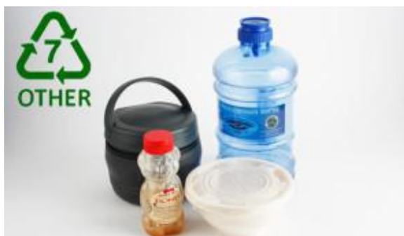
Gambar 6. Plastik yang termasuk dalam jenis OTHER Kode-kode yang tertera pada bawah tempat dari bahan plastik sebagai berikut :

Jika penggunaan plastik berbahan polycarbonate tidak dapat dicegah, janganlah menyimpan air minum ataupun makanan dalam keadaan panas. Biasanya SAN terdapat pada mangkuk mixer, pembungkus termos, piring, alat makan, penyaring kopi, dan sikat gigi, sedangkan ABS biasanya digunakan sebagai bahan mainan lego dan pipa.