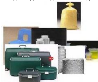
Gambar 4. Plastik yang termasuk dalam jenis Polypropylene

Biasanya dipakai untuk tempat menyimpan makanan, botol minum dan terpenting botol minum untuk bayi, kantong plastik, film, automotif, maianan mobil-mobilan, ember. Tertera logo daur ulang dengan angka 5 di tengahnya, serta tulisan PP