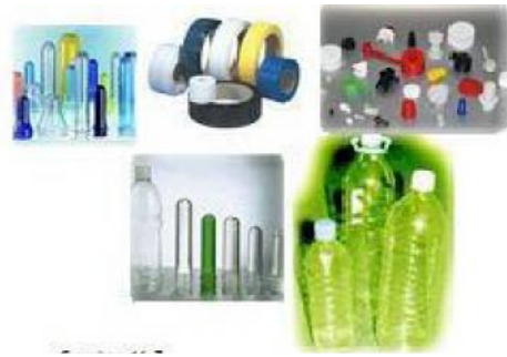
Gambar 1. Plastik yang termasuk dalam jenis PET

tengahnya dan tulisan PETE atau PET ( polyethylene terephthalate ) di bawah segitiga.