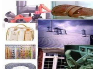
Gambar 3. Plastik yang termasuk dalam jenis Polyvinyl Chloride

pembungkus ( cling wrap ), dan botol-botol, pipa, konstruksi bangunan. Tertera logo daur ulang (terkadang berwarna merah) dengan angka 3 di tengahnya, serta tulisan V — V itu berarti PVC ( polyvinyl chloride ), yaitu jenis plastik yang paling sulit didaur ulang.