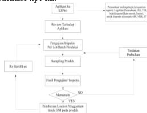
Bagan 3 Skema Sertifikasi Tipe 1b

Skema sertifikasi tipe 1b merupakan skema untuk sertifikasi produk yang menilai hanya kesesuaian produk per batch produksi/per-shipment pengiriman, sehingga tidak diperlukan adanya audit sistem manajemen, dan asesmen proses produksi, namun dengan pengujian atau inspeksi setiap batch pengiriman dengan sampling yang sesuai mewakili produk yang akan disertifikasi. Sertifikat hanya berlaku untuk produk dalam batch yang sama, sedangkan untuk produk lain yang berbeda batch harus dilakukan sertifikasi kembali. Tidak ada mekanisme survailen dalam skema sertifikasi tipe ini. 16