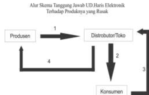
Bagan 4 Alur Skema Tanggung Jawab UD.Haris Elektronik Terhadap Produknya yang Rusak.

jawab produk. Sebelum produk TV tabung yang di produksi UD. Haris Elektronik bersertifikasi SNI, Bapak Kusrin selaku pemilik juga memberikan garansi selama 1 tahun bagi produk TV tabung buatannya yang dijual di kisaran harga 400 ribu rupiah. Setelah TV tabung buatannya mendapat sertifikasi SNI pemberian garansi pun tidak berubah, yaitu pemberian garansi selama 1 tahun. Apabila setelah lewat masa garansi yang diberikan TV tabung mengalami kerusakan konsumen dapat membawa TV tabung ke UD.Haris Elektronika untuk dilakukan perbaikan. Untuk TV tabung yang mengalami kerusakan dan masih dalam masa garansi, maka TV tabung dapat dibawa ke distributor/toko tempat dimana konsumen membeli produk TV tabung tersebut, dan kemudian distributor/toko akan membawa TV tabung tersebut ke UD.Haris Elektronik untuk dilakukan perbaikan. Apabila produk sudah mengalami kerusakan ketika sampai di tangan distributor atau sampai di toko, maka secara langsung TV tabung yang rusak akan diganti dengan TV tabung yang baru. 23 Alur dari klaim garansi adalah sebagai berikut: