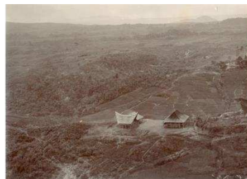
Gambar 1. Daerah dataran tinggi Batak dekat Danau Toba