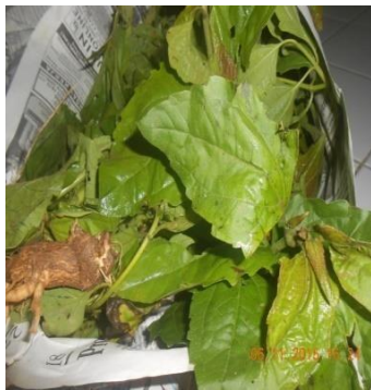
Gambar 3. Chromolaena odorata L