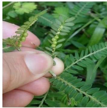
Gambar 4. Phyllanthus amarus

Sutriyono et al. (2009) menyatakan bahwa semakin tinggi nilai SDR suatu spesies maka semakin besar penguasaannya terhadap faktor biotik dan abiotik yang terdapat di lingkungan tersebut. Hal ini menunjukkan bahwa nilai SDR sebesar 34.81% pada Brachiaria reptans mampu menguasai semua faktor biotik dan abiotik sebanyak 34.81% dan Axonopus compressus (8.64%), dan Chromolaena odorata L (6.52%).