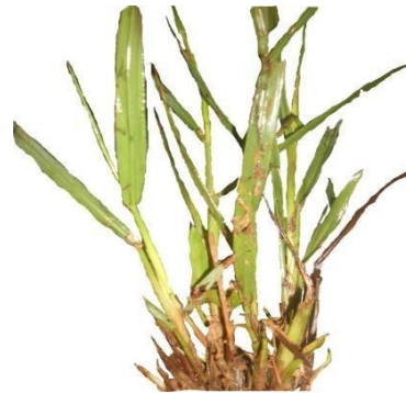
Gambar 2. Axonopus compressus