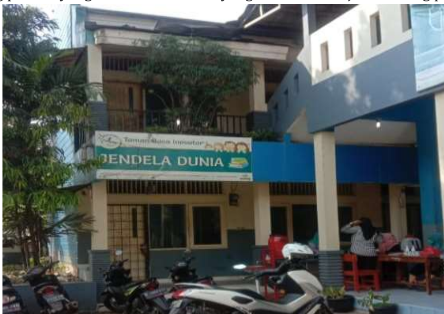
Gambar 1. Gedung Taman Baca Inovator

Yayasan Taman Baca Inovator dibangun semata-mata bertujuan untuk membangun literasi dan minat baca dari anak-anak Indonesia. Penamaan Inovator untuk taman baca ini memiliki arti dan tujuan khusus yaitu dengan harapan bahwa salah satu dari anak-anak yang membaca di Taman Bacaan ini dapat menjadi seorang pribadi yang memiliki karakter yang baik dan menjadi seorang penemu.