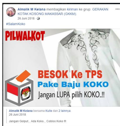
Gambar 4. Tangkapan Layar Facebook