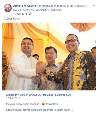
Gambar 3. Tangkapan Layar Facebook

orang-orang yang mendukung DIA-mi sehingga tidak heran jika penjelasan grup GKKM adalah bentuk opini publik untuk memperburuk pasangan calon tunggal.