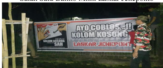
Gambar 1. Salah Satu Baliho Milik Laskar Jeneponto