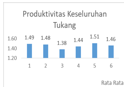
Gambar 2. Produktivitas Keseluruhan Tukang