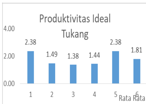
Gambar 1. Produktivitas Ideal Tukang

Berdasarkan pengamatan 5 tukang batu bata yang dilakukan di lapangan, untuk produktivitas keseluruhan tukang batu bata, produktivitas keseluruhan terbesar diperoleh oleh tukang 5 yaitu sebesar 1,51 m 2 /jam dan produktivitas keseluruhan terkecil diperoleh tukang 3 yaitu sebesar 1,38 m 2 /jam dengan jumlah siklus yang terjadi yaitu 3 siklus. Maka produktivitas tukang perhari yang terbesar adalah 12 m 2 /hari > 10 m 2 /hari (SNI).