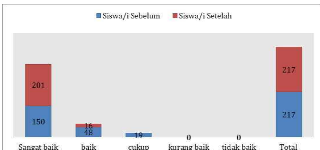
Gambar 3. Hasil evaluasi nilai pengetahuan sebelum dan sesudah edukasi kesehatan pencegahan penularan COVID-19

Pada akhir penyuluhan pendampingan dan evaluasi kegiatan dengan post-test kegiatan dan dilakukan role play yang diikuti oleh seluruh murid dan guru bersama tim pelaksana terkait simulasi cuci tangan 6 langkah guna sebagai dasar pencegahan penularan COVID-19. Rerata siswa/i memiliki pengetahuan yang sangat baik terkait pencegahan penularan COVID-19 dengan dengan vaksinasi, menerapkan protokol 5M, 3T, serta VDJ dan mempraktekkan cuci tangan 6 langkah dengan gerakan yang benar.