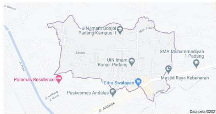
Anduring Kec. Kuranji, Kota Padang, Sumatera Barat