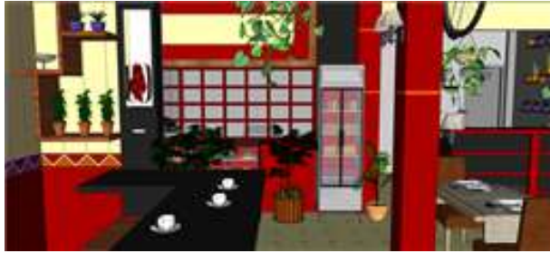
Gambar 8. View area dapur