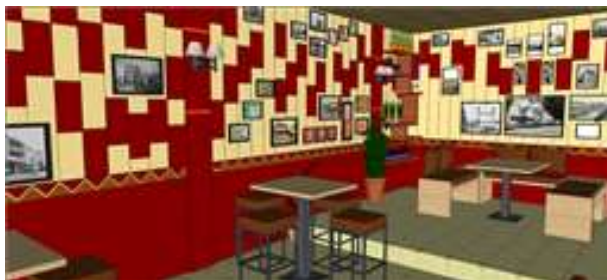
Gambar 12. Desain dinding interior kafe