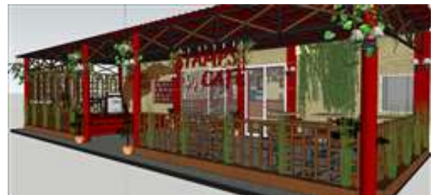
Gambar 13. Tampak depan suasana kafe