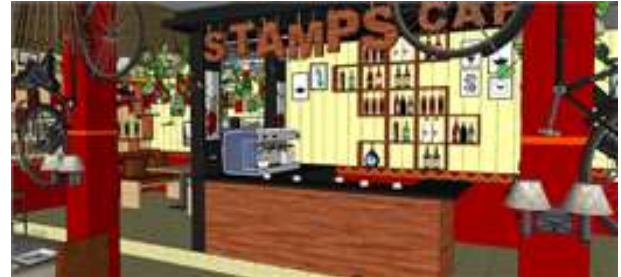
Gambar 11. Aksesoris pada mini bar