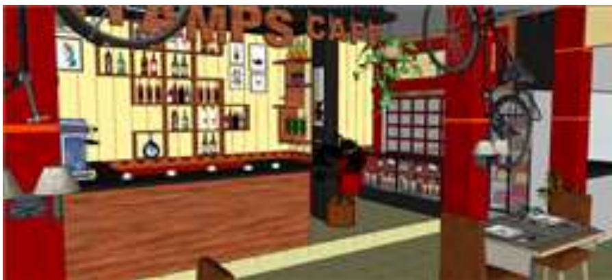
Gambar 6. Desain Mini bar