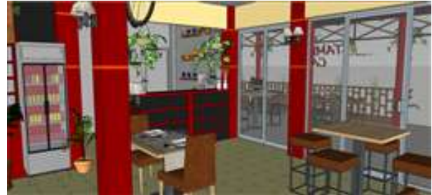
Gambar 9. View ke area kasir