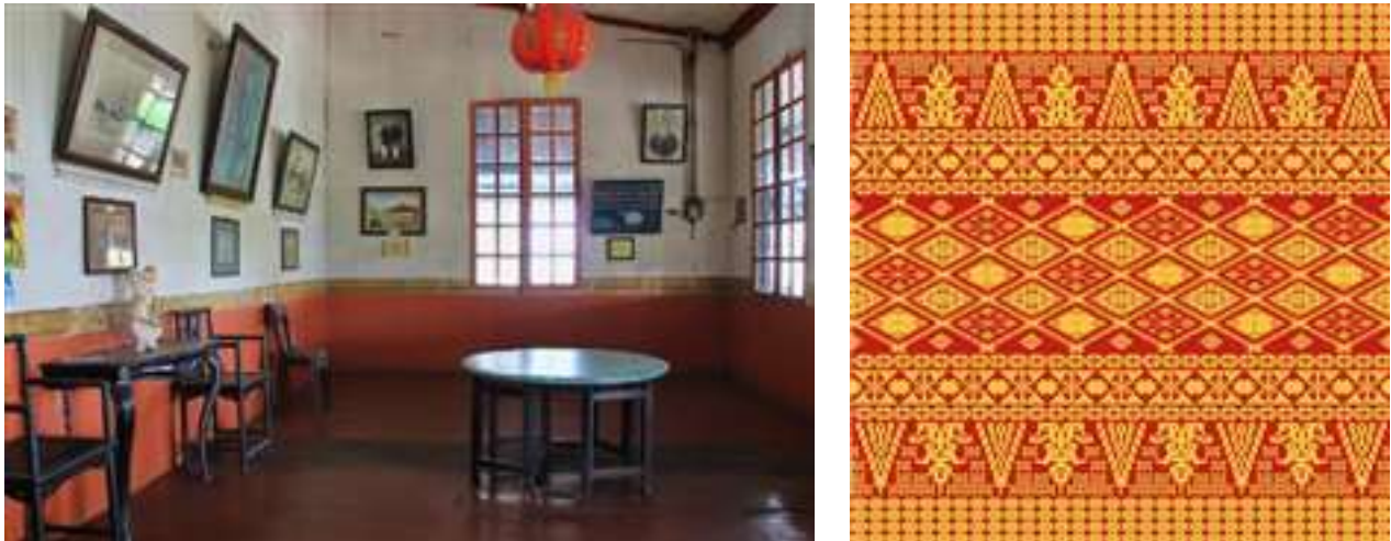
Gambar 3. Interior rumah kampung kapitan (kiri) dan Motif songket Palembang (kanan)

Stamps Kafe akan menggunakan tiga area utama yaitu: Public area berada di luar dan didalam ruangan yang menjadi bagian utama dalam suatu ruangan. Area publik pada Stamps Kafe ini terdapat di ruang indoor dan outdoor . Pada area dalam disandingkan dengan perletakan mini bar , sedangkan pada area semi outdoor disandingkan dengan panggung music secara langsung. Private area pada stamps kafe bersifat tertutup atau sedikit ke dalam. Private area pada kafe ini yaitu pada area ruang kasir, area bar, area dapur yang hanya dapat dimasuki oleh pemilik usaha dan karyawan. Service area pada stamps afe terdapat pada area parkir dan kamar mandi.