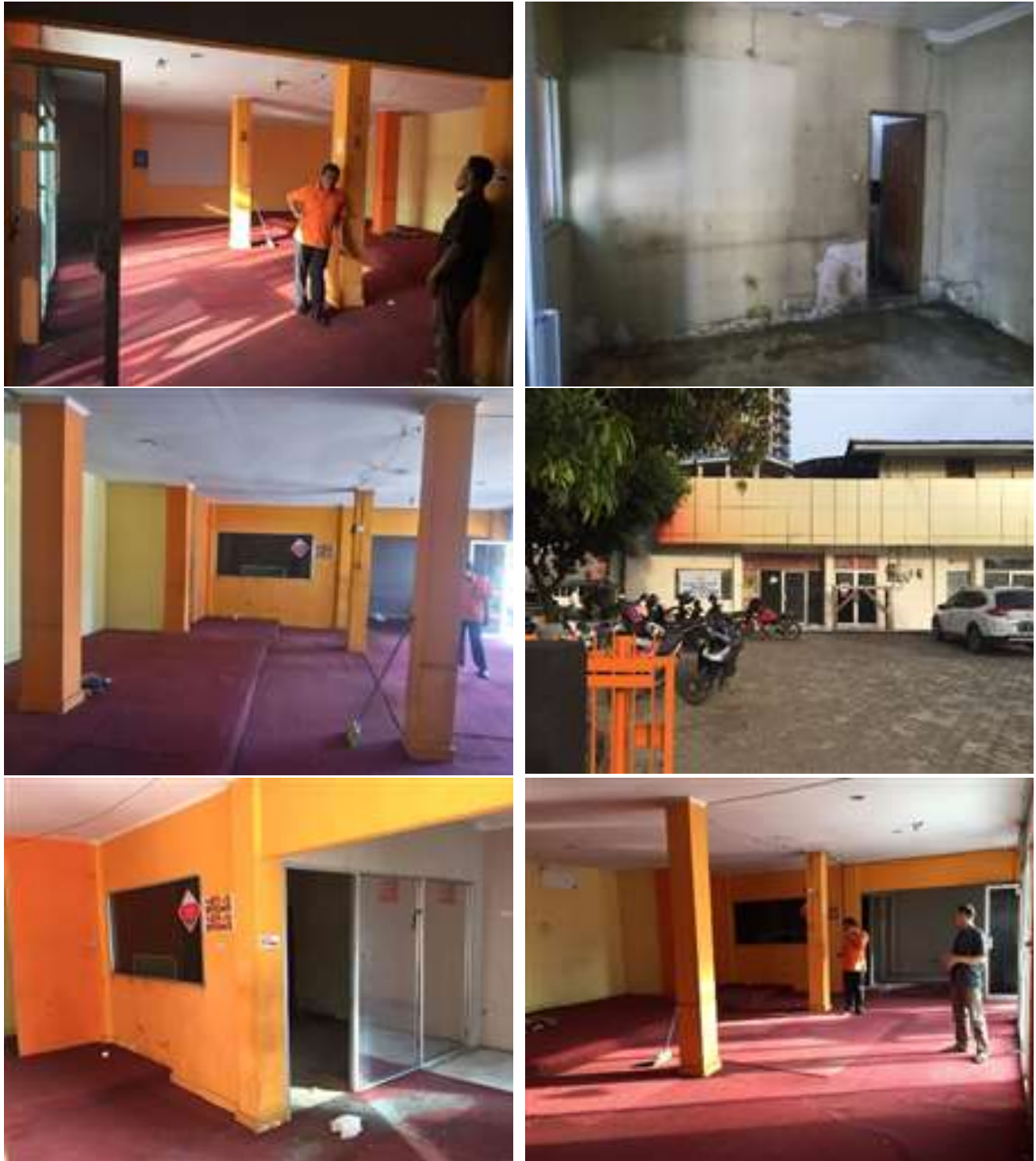
Gambar 2. Foto Eksisting Kafe

sketchup 3D. Dari sketchup 3D dapat dihasilkan gambar 2D maupun 3D dengan bentuk yang lebih arsitektural. Hasil 3D visualisasi yang sudah dihasilkan akan merepresentasikan suasana yang sama dengan kondisi sebenarnya di lapangan dan sudah dapat dijadikan acuan dalam proses pengerjaan dan finishing interior.