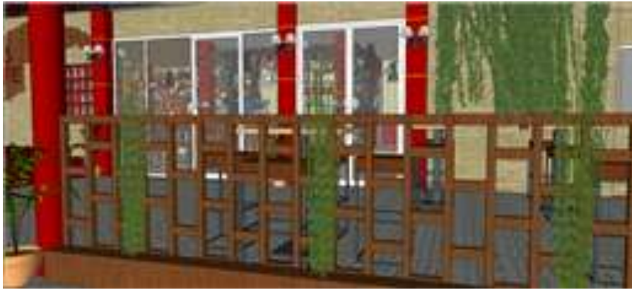
Gambar 4. Desain railing area semi outdoor