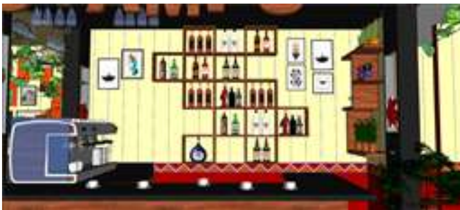
Gambar 7. Desain aksesoris pada dinding