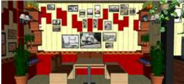
Gambar 10. Desain suasana kafe