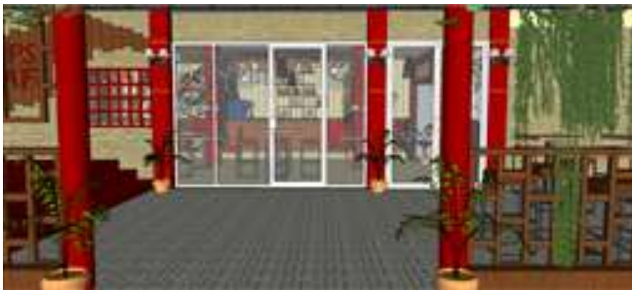
Gambar 5. Entrance kafe