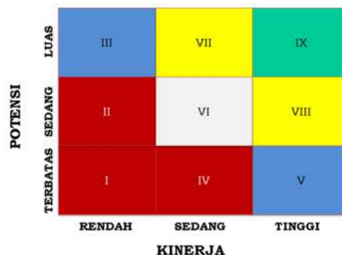
Gambar 3. Boks Pemetaan Pegawai Kementerian Keuangan Berdasarkan Kompetensi dan Kinerja

Di tahap pertama manajemen talenta, Kementerian Keuangan melakukan analisis kebutuhan talent . Dalam menganalisis kebutuhan talent , Kementerian keuangan melakukan identifikasi jabatan target. Identifikasi jabatan target dilakukan dengan cara menentukan besaran kebutuhan talent sebelum Kementerian Keuangan mengelola dan mengembangkannya, hingga akhirnya dilakukan analisis atas rasio besaran kebutuhan talent dengan jabatan kosong yang ditargetkan dalam manajemen talenta. Pada tahap berikutnya, Kementerian Keuangan melakukan identifikasi calon talent , yang terdiri atas pemetaan pejabat atau pegawai, seleksi track record dan integritas. Tahap ini dilakukan dalam rangka memastikan calon talent memiliki integritas tinggi dan tidak pernah terlibat dalam hukuman disiplin kategori fraud . Selain itu, identifikasi calon talent juga dilakukan dengan tahap seleksi administrasi, dan penetapan calon talent dengan menyelenggarakan forum pimpinan.