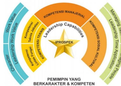
Gambar 2. Leadership Framework Kementerian Keuangan