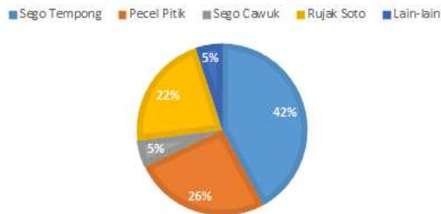
Gambar 5. Makanan Khas Banyuwangi (tanpa pilihan jawaban)

Rendahnya tingkat kesadaran dan pengetahuan masyarakat Banyuwangi tersebut dikhawatirkan menggiring opini publik tentang kuliner khas Banyuwangi yang tidak sesuai dengan konsep segitiga gastronomi Indonesia. Survei kepada 100 responden yang diminta menyebutkan satu makanan khas Banyuwangi tanpa diberi pilihan jawaban (secara spontan), hasil jawaban terbanyak adalah nasi tempong sebesar 42% (grafik 3.2). Hasil ini menyatakan bahwa brand identity kuliner khas Banyuwangi yang paling banyak dalam benak masyarakat Banyuwangi adalah nasi tempong.