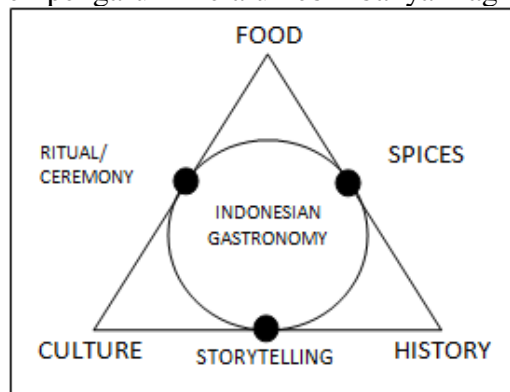
Gambar 2. Konsep gastronomi Indonesia

Menurut Messakh dan Indonesia Ministry of Tourism (2017), konsep pariwisata gastronomi secara keseluruhan unik dan menarik karena dari berbagai aspek suatu destinasi wisata. Sebagai contoh, pariwisata gastronomi di Indonesia dipengaruhi oleh sejarah, budaya, dan makanan, yang saling mempengaruhi melalui lebih banyak lagi aspek khusus.