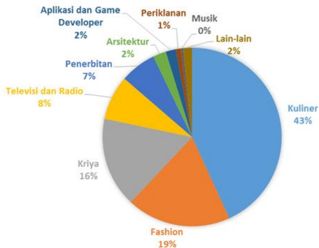
Gambar 1. Kontribusi Kuliner dan Belanja terhadap Ekonomi Indonesia Tahun 2017

Prestasi dalam industri ini perlu diimbangi dengan komponen-komponen pendukung suatu destinasi pariwisata yaitu attraction , accessibility , amenity dan anciliary (Cooper et al , 1993). Sesuai urutannya, komponen utama destinasi pariwisata adalah attraction (Cooper et al , 1993; Pitana, 2009; dan Tourism Western Australia , 2009).