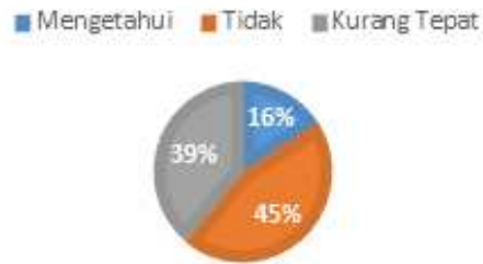
Gambar 4. Tingkat Kesadaran dan Pengetahuan Masyarakat Banyuwangi tentang Gastronomic Tourism