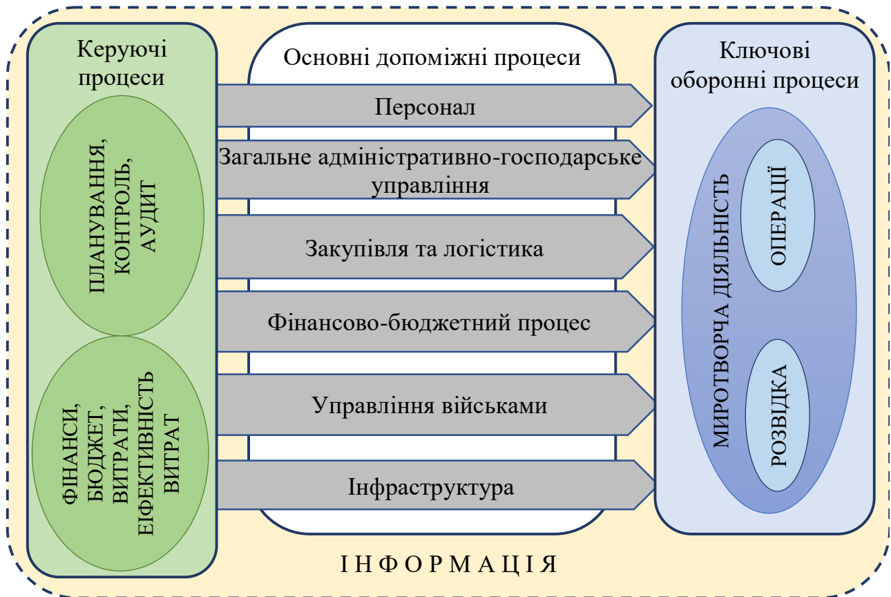
Малюнок 2 – Структура основних процесів та взаємодії між елементами системи управління оборонними ресурсами

сектору оборони в рамках забезпеченості достатнього рівня обороноздатності держави у певний момент часу в умовах обстановки, що складається навколо та в середині неї.