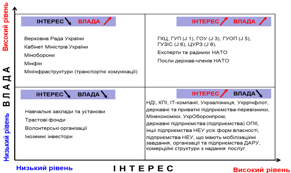
Рисунок 2 – Матриця Влади та Інтересів екосистеми логістики ЗС України

Для визначення подальшої роботи із складовими системи, використано матрицю Влади та інтересів, та визначено чотири напрямки співпраці з ними (Рис. 2).