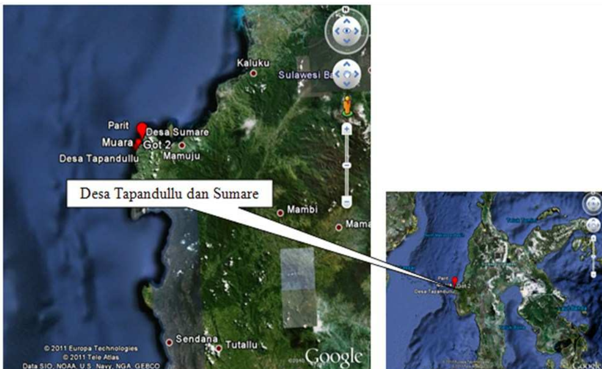
Gambar 1. Lokasi Survei Entomologi Desa Tapandullu dan Desa Sumare Kecamatan Simboro Kabupaten Mamuju Provinsi Sulawesi Barat

Pada penangkapan tanggal 25 Februari 2011, juga hanya didapatkan 1 spesies nyamuk yaitu Anopheles subpictus