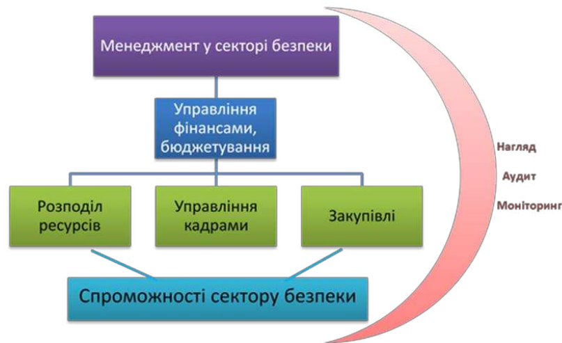
Малюнок 1. Забезпечення спроможності сектору безпеки

У випадку перенесення вищезазначеного в площину організації оборонного планування на основі спроможностей в оборонному відомстві України, можна зобразити місце процесу управління ризиками в бюджетуванні (мал. 2).