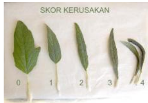
Gambar 1. Skor kerusakan daun wijen oleh P. latus .

Skor 0 = sehat 1 = 1–25% terserang sebagian 2 = 26–50% keriting sebagian hingga setengah 3 = 51–75% keriting hampir semua 4 = 76–100% keriting hingga daun melengkung