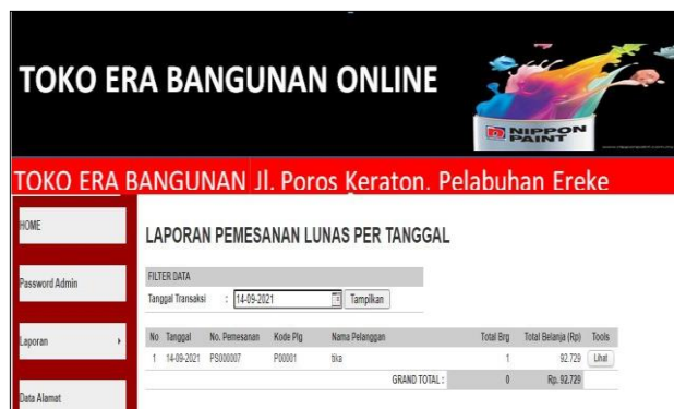
Gambar 7. Laporan Data Pemesanan Lunas Per Tanggal

Laporan data pemesan lunas per tanggal seperti pada gambar diatas akan muncul ketika di klik menu laporan dan mengklik sub menu laporan data pemesanan lunas per tanggal seperti yang ditunjukkan pada Gambar 7.