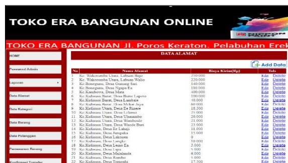
Gambar 8. Halaman Data Alamat

Halaman ini berisi data alamat pelanggan yang terdaftar dan pernah melakukan pembelian di Toko Era Bangunan. Berikut tampilan daftar alamat pelanggan yang ditunjukkan pada Gambar 8.