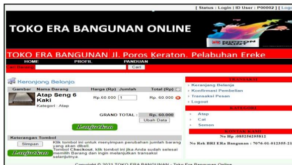
Gambar 9. Halaman Keranjang Belanja

Halaman keranjang belanja merupakan halaman yang berisi barang yang ingin dibeli tetapi belum melakukan pemesanan dan halaman keranjang belanja, halaman ini akan muncul ketika mengklik menu keranjang belanja yang di tunjukkan pada Gambar 9.