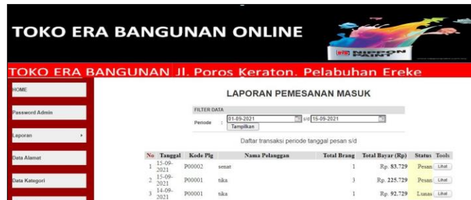
Gambar 6. Laporan Data Pemesanan Masuk Per Periode

Halaman laporan data pemesanan masuk per periode akan muncul ketika di klik menu laporan dan mengklik sub menu laporan data pemesanan masuk per periode yang ditunjukkan pada Gambar 6.