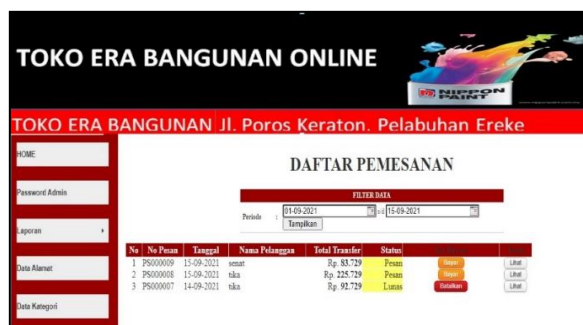
Gambar 10. Halaman Pemesanan Barang

Halaman pemesanan barang merupakan halaman yang berisi daftar pemesanan barang dan daftar pemesanan barang berdasarkan periode. Halaman pemesanan barang akan muncul ketika mengklik menu pemesanan barang yang ditunjukkan pada Gambar 10.