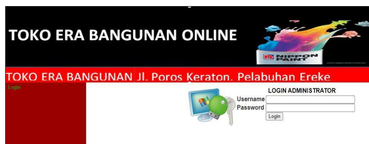
Gambar 2. Form Login

Fitur login digunakan untuk membatasi akses pengguna yang berhak mengakses aplikasi untuk menjaga data yang tersimpan tetap terjaga kerahasiannya. Tampilan halaman login di tunjukkan pada Gambar 2.