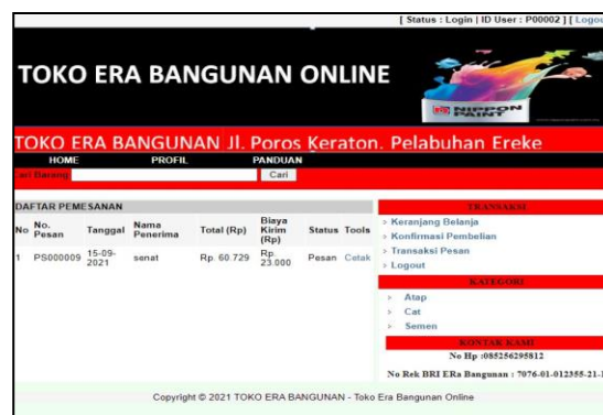
Gambar 11. Halaman Transaksi Pesanan

Halaman transaksi pemesanan merupakan halaman yang berisi barang pesanan dan halaman transaksi pesanan. Halaman ini akan muncul ketika mengklik menu transaksi pesan. Adapun tampilan transaksi pesanan ditunjukkan pada Gambar 11 dan Gambar 12.