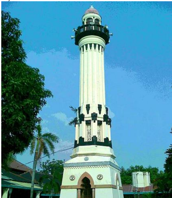
Gambar 3. Menara Masjid Agung Surakarta.

berdasarkan atas bangunan yang ada di Indonesia namun dari bentuk masjid-masjid yang berada di daerah Gujarat (India) (Adityaningrum et.al, 2019). Pengaruh dari arsitektur India terlihat pada penggunaan elemen-elemen yang ada seperti garis simetris, elemen selang-seling pada menara, serta penggunaan ornamen pada setiap peralihan yang ada. Hanya saja, terdapat beberapa perbedaan antara keduanya, yakni material bahan yang digunakan. Material yang digunakan Kutab Minar adalah batu bata merah yang disusun satu per satu sedangkan material pada menara azan Masjid Agung Surakarta adalah beton bertulang (Yuniati, 2017).