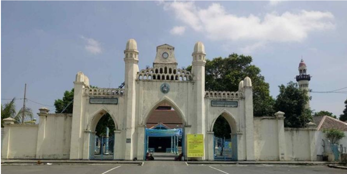
Gambar 5. Gapura Masjid Agung Surakarta