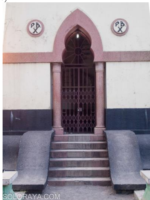
Gambar 4. Pintu Menara Masjid Agung Surakarta.

(Adityaningrum et.al, 2019). Fungsi gapura ini adalah sebagai gerbang utama yang mempertemukan kompleks Masjid Agung Surakarta dengan kawasan Alun-alun Keraton Surakarta. Pada gapura terdapat tiga pintu di mana setiap pintu terdapat beberapa simbol. Pada pintu tengah terdapat relief dari kayu yang menggambarkan bumi, bulan, matahari, dan bintang dengan mahkota raja di atasnya. Sementara itu, pintu pengapit sisi utara dan selatan terdapat panil kayu berhias relief Arab (Adityaningrum et.al, 2020). Pada awalnya, gapura ini mengadopsi konsep candi yakni Candi Bentar. Kemudian, gapura dengan lengkung Persia dibuat untuk merenovasi gapura sebelumnya dimana renovasi ini dilakukan pada masa pemerintahan Paku Buwono X. Adapun pengaruh arsitektur Persia terlihat pada penggunaan bentuk lengkung pada arkus dan ornamen lengkung bagian atas gapura (Yuniati, 2017).