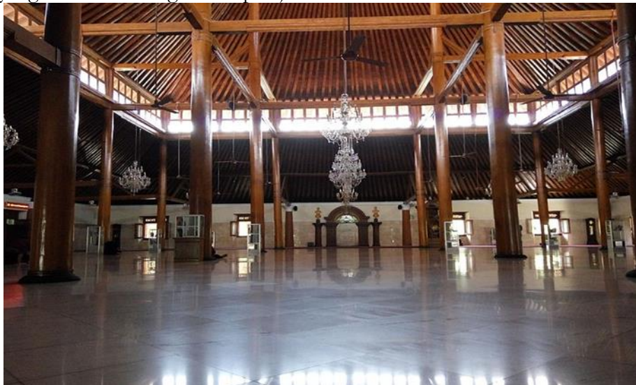
Gambar 2. Soko guru Masjid Agung Surakarta.

memanifestasikan konsep kosmologi diwujudkan dari empat soko guru yang melambangkan pajupat (empat penjuru mata angin) dan atap tajuk dengan mahkota dan lampu gantung yang melambangkan pancer . Keempat soko guru (lihat gambar 2) berbentuk silinder dari bahan kayu terletak pada poros ruang utama dan sebagai penopang atap tajuk bagian puncak. Soko guru merupakan elemen struktur yang sangat penting karena memiliki keterkaitan langsung dengan konsep kosmologi Jawa dengan keempat pilarnya membentuk pajupat/mancapat dan menjadi dasar awal dibentuknya masjid. Selain itu, keempat soko guru juga merupakan simbol empat kekuatan yang memiliki keseimbangan sehingga mampu menyokong atap tajuknya di samping memberikan keserasian kekuatan bentuk dan hubungan antar elemen (Adityaningrum, Pitana, dan Setyaningsih, 2020).