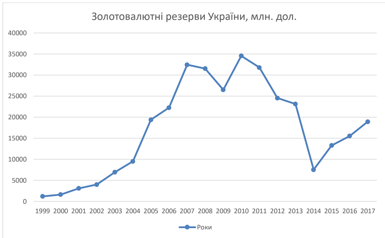
Рис. 2 Золотовалютні резерви України [2,3].

Звідси випливає ще один чинник впливу на курс національної валюти – державний борг. На початку 2015 року фінансові запозичення державою (у МВФ, ЄБРР та інших міжнародних фінансових установах) допомогли дещо стабілізувати гривню адже частина валюти використовувалася урядом для інтервенцій. В тому ж році Національний банк України (НБУ) запозичив у МВФ 5 млрд. доларів США для своїх резервів, які держава буде погашати з 2019 по 2025 роки. Основні виплати по державному боргу та по боргу НБУ припадають на 2019 – 2024 роки (рис. 3). Саме ці роки будуть найбільш важкими для національної економіки, що може призвести до ще більшого ослаблення гривні.