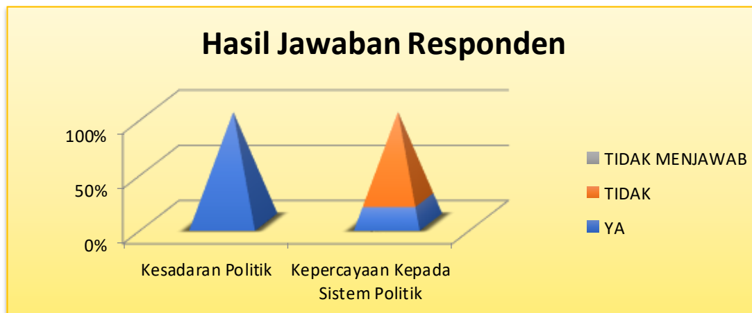
Gambar 1: Persentase Kesadaran Politik Dan Kepercayaan Kepada Sistem Politik Responden

Terlihat bahwa mayoritas mahasiswa memiliki kesadaran Politik tinggi namun kepercayaan kepada sistem politik rendah. Jika dianalisa dengan indikator yang dikemukakan Paige maka partisipasi politik mahasiswa akan terlihat pada salah satu kuadran sebagaimana pada gambar 2. Sebagai berikut :