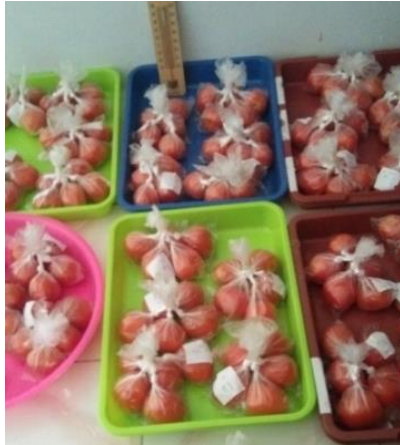
Gambar 1. Proses persiapan sampel