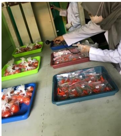
Gambar 2. Pemaparan medan magnet ELF

Analisis statistik deskriptif digunakan sebagai metode penelitian menggunakan Microsoft Office Excel 2010 dan IBM SPSS Statistik 23 . Uji statistik diterapkan agar terlihat tidak ada atau adanya suatu perbedaan pada sampel yang berpasangan yaitu kelompok kontrol dan eksperimen dengan uji kruskal wallis . Penelitian ini menggunakan Hipotesis nol ( H_0 ) dan hipotesis alternatif ( H_a ). Hipotesis nol ( H_0 ) yang membuktikan tidak ada perbedaan antara kelompok kontrol dan eksperimen (E-600 \mu T.30", E-600 \mu T.60", E-600 \mu T.90", dan E-1000 \mu T.30", E-1000 \mu T.60", E-1000 \mu T.90") dan hipotesis alternatif ( H_a ) membuktikan ada perbedaan antara kelompok kontrol dan kelompok eksperimen (E-600 \mu T.30", E-600 \mu T.60", E-600 \mu T.90", dan E-1000 \mu T.30", E-1000 \mu T.60", E-1000 \mu T.90"). Kriteria pengujian Kruskal Wallis adalah H_a ditolak dan H_0 diterima jika nilai Asymp.sig (2-tailed) > 0,05 (Sukestiyarno, 2014).