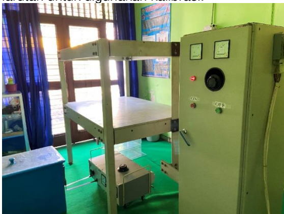
Gambar 1. Current Transformer

Penelitian ini menggunakan jenis penelitian eksperimen laboratorium dengan cara membandingkan antara dua kelompok yakni kelompok kontrol dengan kelompok eksperimen. Desain yang dipergunakan dalam penelitian ini yaitu randomized subjects post test only control group design agar dapat mengetahui pengaruh dari paparan medan magnet ELF. Bahan yang digunakan dalam penelitian ini antara lain yaitu tempe yang diperoleh dari pembuat tempe di daerah Jember, dan juga aquades. Alat yang digunakan pada penelitian ini adalah sumber medan magnet (ELF) Extremely Low Frequency yang berupa CT atau ( Current Transformer ) menjadi penghasil dari medan magnet (ELF) Extremely Low Frequency , ada pula EMF tester dengan tipe Lutron EMF-827 guna untuk mengukur akbar dari adanya medan magnet, pH meter yang dipergunakan menjadi alat pengukur suatu nilai pH, neraca yang fungsinya untuk menimbang tempe terhadap masing-masing kelompok, dan beaker gelas yang berfungsi sebagai wadah larutan untuk digunakan kalibrasi.