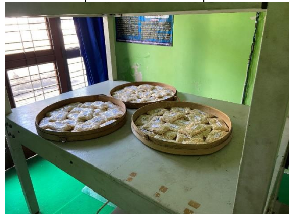
Gambar 2. Proses Pemaparan Tempe Menggunakan Medan Magnet ELF

penelitian ini pertama-tama yakni menyiapkan 145 tempe yang telah diragi, lalu membagi tempe tersebut menjadi dua kelompok ialah kelompok eksperimen dan kelompok kontrol. Kelompok kontrol yang berjumlah 25 buah tempe, sedangkan kelompok eksperimen yang berjumlah 120 buah tempe. Untuk kelompok eksperimen terbagi menjadi 2 yakni kelompok I dipaparan medan magnet ELF 200 \mu\text{T} , dan kelompok II dipaparan medan magnet ELF 300 \mu\text{T} , terhadap masing-masing dari kelompok berisi 60 buah tempe. Lalu memberikan suatu perlakuan dengan memapari tempe tersebut dengan medan magnet ELF untuk kelompok eksperimen selama 30 menit, 60 menit, dan 90 menit. Pengukuran pH dilakukan pada jam ke-0 (sebelum dipapar medan magnet ELF), jam ke-12, jam ke-24, jam ke-36, jam ke-48 setelah dipapar medan magnet ELF. Pada tahapan selanjutnya melakukan analisa data, teknik yang dipergunakan didalam suatu analisa data penelitian ini yaitu dengan menggunakan Microsoft Excel yang digunakan untuk membuat suatu grafik ada tidaknya pengaruh antara kelompok kontrol dan eksperimen.