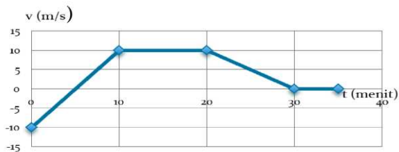
Gambar 5. Soal Nomor 2

Kemampuan mahasiswa dalam membaca grafik sudah cukup baik, pemahaman mahasiswa di atas 50% kecuali soal nomor 2. Soal nomor 2 dapat dikatakan soal yang paling sulit karena hanya 25% mahasiswa yang paham. Sedangkan 60% mahasiswa cenderung paham maksudnya pemahaman mahasiswa tidak utuh atau hanya paham sebagian, Soal nomor dua menampilkan grafik kecepatan terhadap waktu, ditunjukkan pada Gambar 5 berikut: