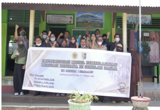
Gambar 6. Foto bersama tim dengan guru di depan SD Negeri 1 Sembalun