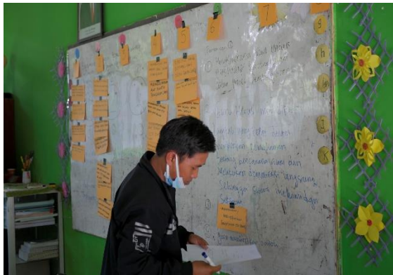
Gambar 3. Guru menulis kalimat yang mewakili pokok pikiran yang diusulkan