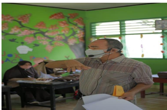
Gambar 5. Tim memimpin teknik moderasi