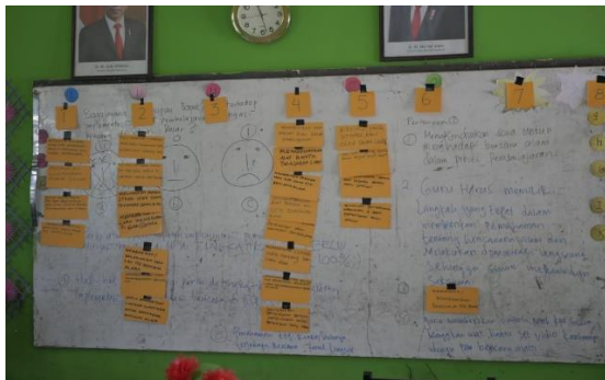
Gambar 4. Kartu-kartu usulan (zoop) yang ditempatkan sesuai pokok pikiran