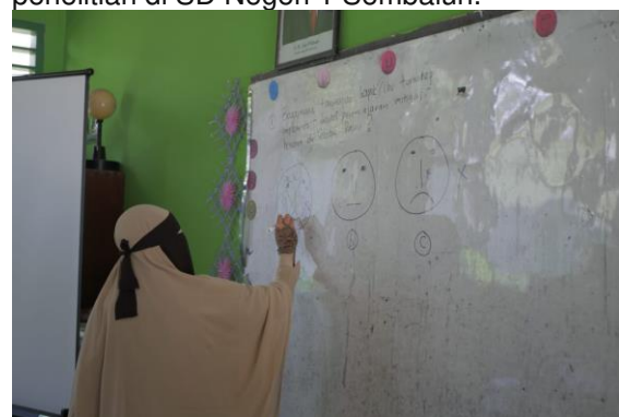
Gambar 2. Guru memilih sesuai emosinya dipertanyaan pertama

(6), tim membimbing diskusi untuk memecahkan permasalahan yang muncul dari tanggapan dan pendapat guru dengan membuat tabel pemecahan yang intinya berisi kondisi saat ini, kondisi sekarang, penanggung jawab, dan waktu yang dibutuhkan untuk menyelesaikannya. Selanjutnya tim dan guru akan terus berkomunikasi untuk mengatualisasi kan hasil teknik moderasi implementasi model pembelajaran mitigasi bencana di sekolah dasar. Berikut adalah foto-foto kegiatan penelitian di SD Negeri 1 Sembalun.