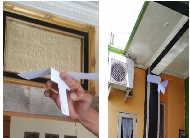
Gambar 6 : helikopter sederhana

hanya memiliki satu sayap, tetapi juga dapat berputar pada waktu jatuh. Arah putarnya ditentukan oleh bentuk sayap yang tidak simetris. Helikopter nyata tidak punya sayap, tapi baling-baling yang dapat berputar karena digerakkan oleh motor. Baling-baling tersebut memiliki bentuk tertentu sehingga pada saat berputar helikopter dapat naik.