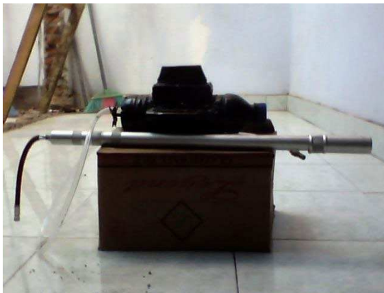
Gambar 1 : Alat Peraga Kapal Selam Sederhana

Kit fluida alternatif dari bahan-bahan lingkungan dan mudah didapatkan yang berhasil dibuat oleh tim terdiri dari: (1) alat peraga kapal selam sederhana. Kapal selam sederhana ini terbuat dari berbagai jenis botol plastik yang disatukan dengan lem sehingga berbentuk kapal selam. Bagian dalam dari kapal selam ini diberi balon untuk zat pengapung. Alat ini mampu memperlihatkan kepada peserta didik bagaimana sebuah kapal selam bisa mengapung, melayang dan tenggelam di air. Hal ini akan memberikan contoh nyata kepada peserta didik sehingga konsep terapung, tenggelam dan melayang dapat dipahami dengan baik.