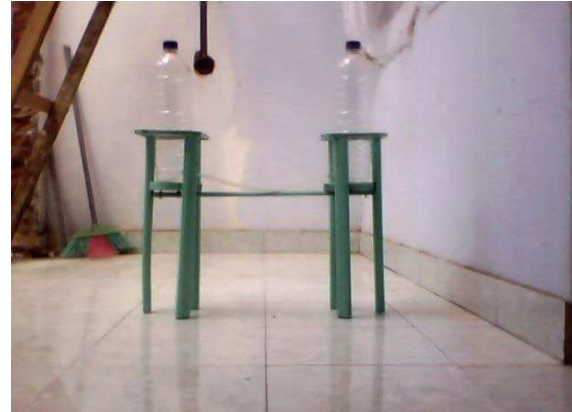
Gambar 2 : Alat Peraga Aliran Air

(2) alat peraga aliran air. Alat peraga ini terbuat dari botol plastik dan selang plastik yang menghubungkan dua botol. Alat ini mampu memperlihatkan kepada peserta didik bahwa aliran air akan terjadi bila ada perbedaan tinggi permukaan air. Hal ini akan memberikan contoh nyata tentang konsep aliran air,