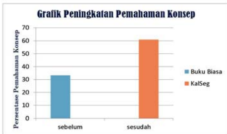
Gambar 4.4 Grafik perbandingan nilai pretest dan posttest

Uji gain dihitung untuk mengetahui efek dari penggunaan media pembelajaran KalSeg, dengan melihat perbandingan nilai pretest dan posttest seperti pada gambar grafik dibawah ini.