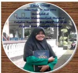
Gambar 4.3 Revisi foto profil belakang media KalSeg

Setelah dilakukan validasi produk, peneliti telah merevisi foto profil belakang media pembelajaran KalSeg dengan menggunakan foto profil seperti pada gambar dibawah ini.