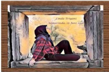
Gambar 4.2 foto profil belakang KalSeg

Ahli III berkomentar pada foto profil sampul belakang kalseg untuk diganti gambarnya dengan menggunakan foto 3x4 almamater.