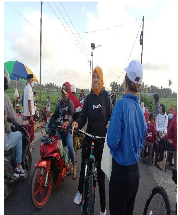
Gambar 5. Pembagian Masker Kepada Warga dan Pengunjung

Keseluruhan rangkaian kegiatan pengabdian kepada masyarakat ini berjalan dengan baik, dan para pengunjung bisa memahami bahwa ancaman COVID-19 belum berakhir. Di masa PPKM berbasis mikro, jumlah kasus COVID-19 terus mengalami peningkatan, sehingga melalui kegiatan pengabdian masyarakat, para pengunjung diimbau untuk tetap waspada dan menerapkan protokol kesehatan yaitu 6M, apalagi di tempat keramaian.