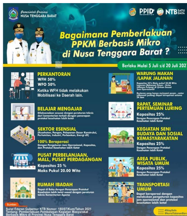
Gambar 1. Aturan Pemberlakuan PPKM Berbasis Mikro Di Provinsi NTB.

berjumlah 19.961 kasus. Untuk mengurangi dan memutus rantai penyebaran COVID-19, Pemerintah Provinsi NTB mulai tanggal 05 – 20 Juli 2021 sesuai arahan dari Pemerintah Pusat melalui Instruksi Menteri Dalam Negeri Nomor 03 Tahun 2021 tentang Pemberlakuan Pembatasan Kegiatan Masyarakat Berbasis Mikro dan Pembentukan Posko Penanganan Corona Virus Disease 2019 Di Tingkat Desa dan Kelurahan Untuk Pengendalian Penyebaran Corona Virus Disease 2019. Selanjutnya, karena masih terjadi peningkatan kasus PPKM Mikro diperpanjang sampai dengan tanggal 26 Juli 2021 dan berlanjut sampai dengan bulan Agustus 2021.