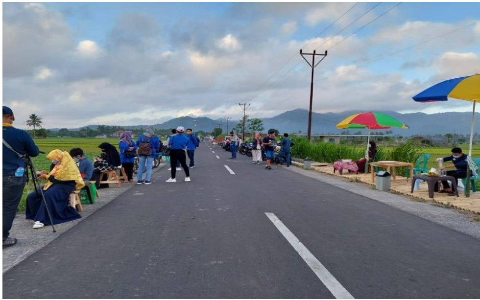
Gambar 2. Lokasi Kegiatan Pengabdian Kepada Masyarakat

Tahap pelaksanaan kegiatan pengabdian kepada masyarakat, tim dosen bekerjasama dengan beberapa mahasiswa serta Pordakwis desa wisata setempat. Tim Pordakwis dalam hal ini membantu mengarahkan dan juga mengatur arus lalu lintas agar tidak mengganggu pengguna jalan yang lain. Langkah pertama dalam pelaksanaan kegiatan PKM ini yaitu memberikan edukasi kepada masyarakat mengenai penularan dan pencegahan COVID-19 pada masa PPKM berbasis mikro. Hal ini dilakukan karena, masyarakat semakin tidak peduli dengan adanya COVID-19 (Yunia, et al., 2021). Edukasi yang diberikan yaitu penerapan protokol kesehatan pada masa PPKM berbasis mikro.