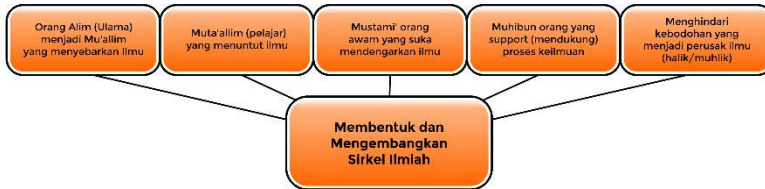
Bagan 1 Membentuk dan Mengembangkan Circle Ilmiah

empat golongan orang di atas, tidak dirusak oleh golongan kelima yang dapat merusak tatanan intelektual umat Islam.