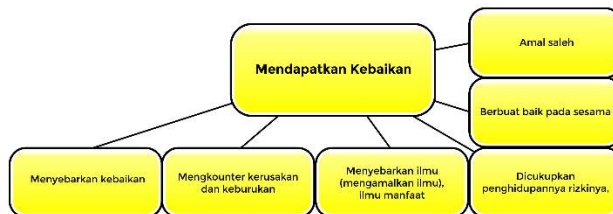
Bagan 3 mendapatkan kebaikan

Sesuai salah satu hadis telah dipaparkan bahwa ahli ilmu (orang-orang yang merespon positif ilmu), tidak akan melakukan kerusakan. Lawan dari menciptakan kerusakan adalah menebarkan kebaikan. Pendidikan Islam bertujuan untuk menyiapkan generasi yang baik, generasi yang sukses di dunia dan sukses di akhirat, generasi yang bermanfaat bagi sesamanya, serta memaksimalkan potensi yang diberikan oleh Allah.