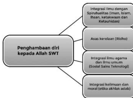
Bagan 2 Penghambaan diri kepada Allah

Hal itulah yang akan menjadikan generasi Islam berkarakter dan bermoral sesuai dengan ajaran Islam, bukan yang mengejar dunia semata apalagi menjadi golongan yang materialistis. Dari sinilah titik balik adanya keterpaduan antara intelektualitas, spiritualitas, dan emosionalitas. Intelektualitas membawa pada kesadaran berilmu, spiritualitas membawa pada kesadaran beragama, dan emosionalitas membawa pada kesadaran sebagai manusia yang bermasyarakat.