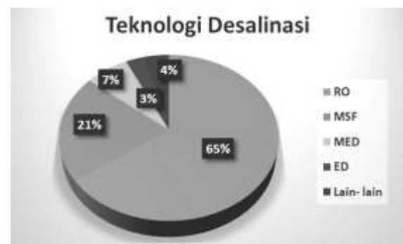
Gambar 1. Kapasitas dan kontribusi teknologi desalinasi global berdasarkan setiap proses.

atau sebesar 65% instalasi RO dari total kapasitas terpasang di seluruh dunia. Sekitar 20- 25% [25] atau sebesar 21% adalah proses MSF [26], [24] dan 5- 15% [25] atau sebesar 7% adalah MED [26], [24]. Terdapat pula teknologi ED sebesar 3- 5% [25], sedangkan sisanya merupakan teknologi desalinasi lainnya.