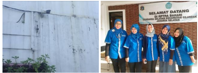
Gambar 5. Kamera CCTV dan para pengelola RPTRA Bahari.

rumah warga. RPTRA juga dilengkapi pagar dan kamera CCTV pada pintu masuknya. Untuk menjaga keamanan dan menghindari kriminalitas, maka pada malam hari pagar RPTRA digembok sehingga RPTRA tidak bisa dikunjungi. Juga terdapat pengelola RPTRA berjumlah 5 orang yang bertugas mengawasi anak-anak ketika berada di RPTRA.