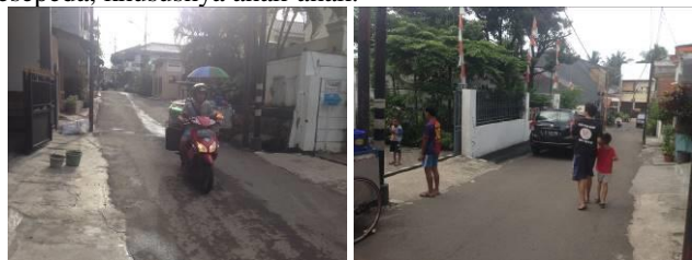
Gambar 9. Kondisi aksesibilitas menuju RPTRA Bahari.

Di dalam aksesibilitas, terdapat kriteria kualitatif berupa terasa dekat, memiliki keterkaitan dengan ruang lain, nyaman bagi pejalan kaki, dan akses yang mudah. Dilihat dari guna lahan sekitar, RPTRA Bahari berada di tengah-tengah kawasan perumahan warga dengan lingkungan perkampungan cukup padat. Hal ini membuat anak-anak sekitar merasa dekat dan cukup mudah untuk menuju ke RPTRA. Semua ruas jalan merupakan jalan dengan skala pelayanan jalan lingkungan, yang menghubungkan antar rumah warga. Ruas jalan masih dapat dilalui oleh dua lajur mobil bersamaan. Kualitas badan jalan di kawasan tersebut dapat dikatakan baik yaitu tidak terdapat jalan yang rusak atau berlubang. Namun, tidak ada daerah khusus pejalan kaki atau pesepeda dan tidak ditemukan zona penyebrangan pada seluruh ruas jalan akses menuju RPTRA Bahari untuk mengakomodasi pejalan kaki dan pesepeda, khususnya anak-anak.