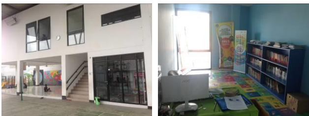
Gambar 4. Berbagai fasilitas penunjang yang ada di RPTRA Bahari.

Kemudian berbagai fasilitas penunjang yaitu berupa bangunan dua lantai di RPTRA ini yang di dalamnya terdapat beberapa fasilitas seperti ruang multimedia, perpustakaan, ruang pengurus, PKK Mart, dan aula serbaguna. Toilet dan ruang laktasi juga berada pada bangunan ini.