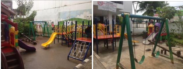
Gambar 2. Fasilitas Bermain di RPTRA Bahari.

peralatan bermain untuk anak-anak diantaranya adalah perosotan, jungkat jungkit, alat panjat mini, dan ayunan. Semua peralatan memiliki pegangan yang bertekstur halus. Perosotan dan jungkat jungkit terbuat dari material plastik, sedangkan ayunan merupakan metal yang juga memiliki permukaan yang halus. Material lantai dasar di sekitar peralatan bermain adalah pasir tanah. Ketebalannya pun cukup dalam sehingga dapat membantu meredam anak jika terjatuh saat bermain.