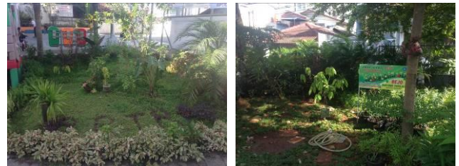
Gambar 6. Berbagai vegetasi yang di RPTRA Bahari.

Terdapat pepohonan yang merupakan bagian dari Program PKK, yang terdiri dari tanaman hias dan obat-obatan. Pohon dan tanaman penghias yang ada diantaranya Ketapang Kencana tinggi 3-4 m, diameter 8-10 cm sebanyak 5 pohon, Palem Sadeng tinggi 3-4 m, diameter 8-10 cm sebanyak 2 pohon, Bougenville tinggi 0,2-0,5 m sebanyak 171 pot, Kemuning tinggi 0,2-0,5 m sebanyak 200 pot dan Puring tinggi 0,5-1 m, sebanyak 288 pot.