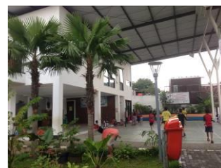
Gambar 7. Atap pelindung RPTRA Bahari.

Tidak ditemukan bahaya polusi di RPTRA Bahari. Dari segi udara, asap kendaraan tidak memiliki dampak besar, karena kepadatan kendaraan yang sangat kecil di lokasi tersebut. Sedangkan untuk asap rokok, terdapat larangan merokok di dalam RPTRA. Selain itu juga terdapat beberapa aturan dan larangan agar pengguna merasa nyaman ketika berada RPTRA yang dipajang di salah satu tembok. Terdapat pepohonan untuk melindungi dari sinar matahari juga atap pelindung yang berfungsi untuk melindungi dari hujan juga bisa melindungi RPTRA dari panas matahari.