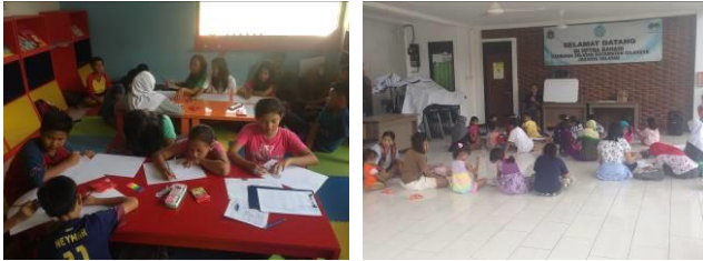
Gambar 8. Ragam aktivitas yang dilakukan di RPTRA Bahari.

latihan tarian tradisional, bimbingan belajar, pelatihan futsal, forum belajar anak, dan senam aerobik. Kegiatan atau aktivitas sudah terjadwal setiap harinya. Aktivitas atau program ini bisa diusulkan oleh pengelola RPTRA dan masyarakat sekitar. Adanya kegiatan di dalam RPTRA tersebut akan membuat orang berkeinginan untuk datang kembali. Apabila tidak ada kegiatan yang dapat dilakukan di dalam ruang publik tersebut, ruang akan menjadi kosong dan akhirnya ruang tersebut mati.