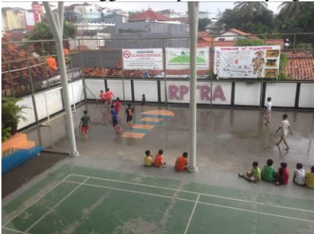
Gambar 3. Fasilitas olahraga berupa lapangan futsal dan badminton.

Untuk fasilitas olahraga terdapat dua fasilitas olahraga yang disediakan di RPTRA Bahari yaitu lapangan futsal dan lapangan badminton yang letaknya bersebelahan. Sarana olahraga di RPTRA ini menggunakan permukaan yang diperkeras.