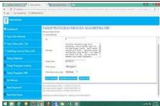
Gambar 2. Simulasi Algoritma NBC Tahap Pengujian