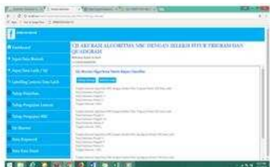
Gambar 3. Hasil Vmap

Pada simulasi pengujian akurasi diperoleh hasil bahwa akurasi algoritma NBC dengan pemilihan fitur trigram data latih model 300 lebih tinggi dibandingkan dengan nilai akurasi algoritma NBC lainnya yaitu sebesar 80%. Untuk menghitung nilai akurasi dari setiap pemilihan fitur, penulis menggunakan rumus sebagai berikut (4).