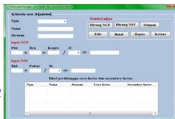
Gambar 4 : Tampilan form perhitungan core factor dan secondary factor aspek non Akademik

Berikut ini adalah tampilan dari form perhitungan core factor dan secondary factor aspek non Akademik, untuk menampilkan menu ini, pilih proses kemudian pilih proses perhitungan core factor dan secondary factor aspek non Akademik.