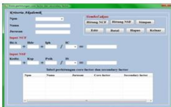
Gambar 3 : Tampilan form perhitungan core factor dan secondary factor aspek Akademik

Berikut ini adalah tampilan dari form perhitungan core factor dan secondary factor aspek Akademik, untuk menampilkan menu ini, pilih proses kemudian pilih proses perhitungan core factor dan secondary factor aspek Akademik.