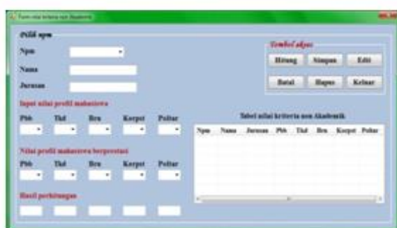
Gambar 2 : Tampilan form nilai kriteria non Akademik

Berikut ini adalah tampilan dari form nilai kriteria non akademik, untuk menampilkan menu ini, pilih tombol akses input nilai kriteria non akademik yang ada pada form pemetaan GAP kompetensi.