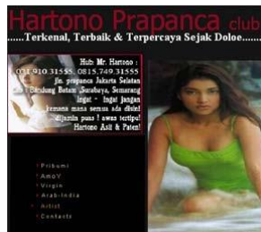
Gambar 1 Website komunitas prostitusi online

Dalam website ditampilkan nomor yang bisa dihubungi. Untuk menjadi member dalam situs tersebut harus melalui pembayaran. Paket sesuai dengan harga. Mulai dari 500 ribu hingga dua juta rupiah.