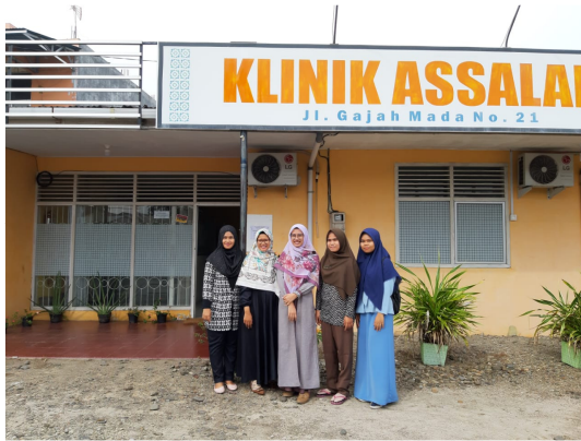
Gambar 1. Kegiatan Sosialisasi