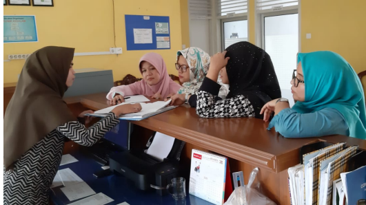
Gambar 2. Sosialisasi ke Petugas Rekam Medis

Berdasarkan hasil observasi dan diskusi dengan peserta sosialisasi didapat informasi bahwa proses pengambilan berkas rekam medis pasien tidak menggunakan tracer tetapi dilakukan dengan cara melihat nomor rekam medis, nama kepala keluarga dan alamat dari pasien yang tertera di KIB (Kartu Identitas Berobat). Dengan tidak digunakannya tracer sebagai penanda berkas rekam medis pasien keluar dari rak penyimpanan, hal ini mengakibatkan terjadinya missfile berkas rekam medis di Klinik As Salam. Missfile merupakan kondisi dimana berkas rekam medis tidak berada pada rak penyimpanan berkas rekam medis yang seharusnya. bukan pada tempatnya.