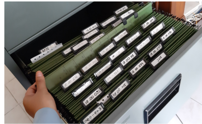
Gambar 5. Sistem penyimpanan RM di klinik As Salam

Sistem penyimpanan berkas rekam medis secara sentralisasi yaitu suatu sistem penyimpanan dengan cara menyatukan berkas rekam medis pasien rawat jalan, rawat darurat, dan rawat inap kedalam satu folder tempat penyimpanan [5].