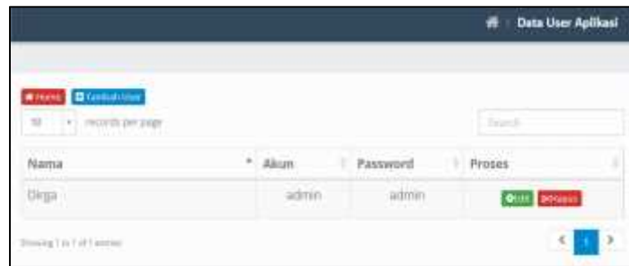
Gambar 3. Tampilan Data User

Pada tampilan form data user untuk memasukan atau menambahkan data user admin