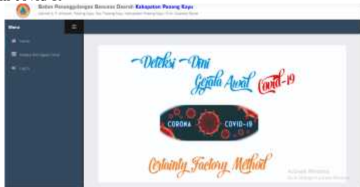
Gambar 2. Halaman Utama Masyarakat

Tampilan menu halaman utama masyarakat digunakan untuk memilih menu dalam sistem deteksi dini covid 19