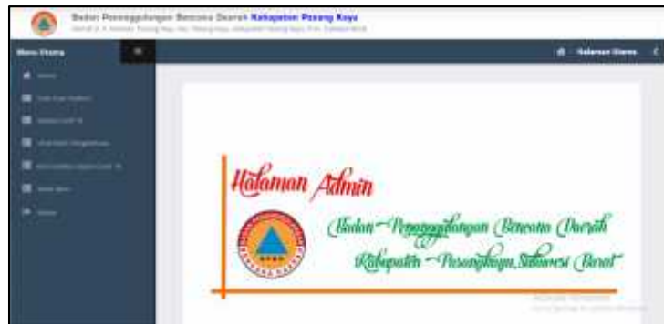
Gambar 1. Halaman Utama Admin

Tampilan menu halaman utama admin digunakan admin untuk memilih menu dan sub menu dalam sistem covid-19.