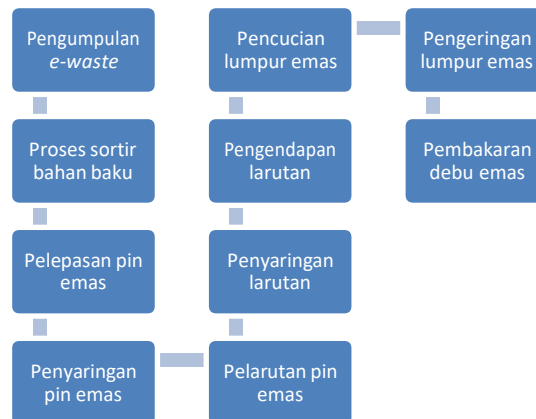
Gambar 2. Proses produksi.

Pada Gambar 2 menunjukkan alur dari proses produksi yang dilakukan. Untuk e-waste yang digunakan difokuskan kepada 3 jenis yaitu RAM, Processor, dan Motherboard. Untuk ketersediaan bahan baku sendiri berdasarkan hasil penelitian Herdayuli (2013) ditemukan bahwa potensi limbah elektronik pada tahun 2015 sebesar 2440 ton/tahun dengan prosentase 60% adalah barang elektronik laptop dengan wilayah cakupan yaitu Kenjeran, Krembangan, Pabean Cantikan. Sedangkan menurut Fentika dan Mirwan (2018) potensi limbah elektronik pada tahun 2021 sebesar 366,842 ton/tahun dengan prosentase 96,25% adalah barang elektronik laptop dengan wilayah cakupan yaitu Tambak Wedi, Bulak Benteng, Kedinding, dan Sidotopo Wetan. Lokasi yang dipilih pada penelitian ini berada di wilayah Tambak Sari, Surabaya dengan luas 200 meter persegi dan biaya sewa 60 Jt per tahun.