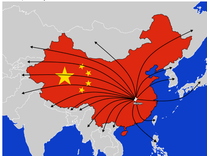
Gambar 3. Penyebaran Coronavirus, update 26 Februari 2020.

Sampai tanggal 25 Januari 2020 (waktu local Beijing), pemerintah Republik Rakyat Cina (RRC) secara resmi mengumumkan kasus konfirmasi 1409, suspected 2032 kasus, dan 42 kematian akibat covid-19 ini, terutama dikaitkan dengan kota Wuhan, Provinsi Hubei. Hampir semua propinsi di RRC melaporkan kasus yang diimpor dari Wuhan dan penularan sekunder juga telah dilaporkan. Penyebaran virus ini dibantu oleh peningkatan penerbangan domestik di RRC pada Tahun Baru Lunar selama 40 hari (10 Januari sd 18 Februari 2020), yang sebenarnya adalah migrasi tahunan terbesar, dengan ratusan juta penduduk bermigrasi, berpindah lokasi di negara RRC (Lai et al. , 2020).