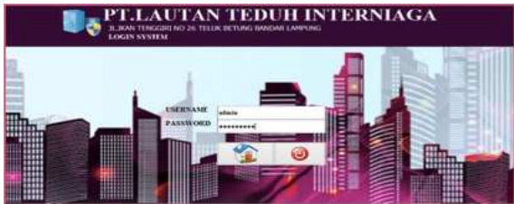
Gambar 3. Tampilan Form Login

Login system merupakan tempat verifikasi identitas atau untuk keamanan suatu aplikasi ataupun berkas penting perusahaan sehingga menjamin tidak adanya terjadinya kecurangan yang tidak diinginkan oleh perusahaan yang akan menyebabkan kerugian besar bagi perusahaan itu sendiri