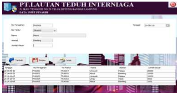
Gambar 7. Form Transaksi Penagihan