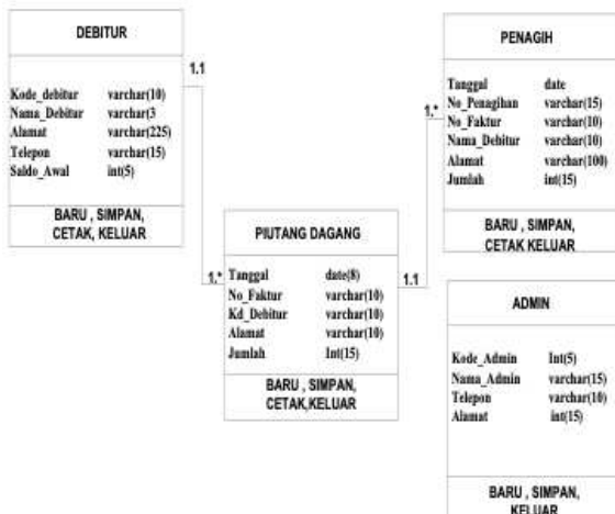
Gambar 2. Rancangan Class Diagram