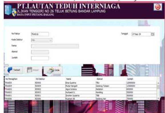
Gambar 6. Form Transaksi Piutang Dagang

Transaksi merupakan suatu aktivitas perusahaan yang menimbulkan perubahan terhadap posisi keuangan. Dalam transaksi piutang dagang ini di ketahui dapat melihat laporan keuangan setiap bulan maupun pertahun, didalam form transaksi piutang dagang ada beberapa inputan seperti tanggal, no faktur, kode debitur, nama, alamat, dan jumlah.