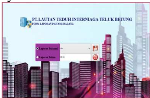
Gambar 8. Form Laporan Per Bulan

Laporan dibuat guna membantu pekerjaan yang lebih efektif dan efisien, Di dalam form laporan terdapat beberapa menu input , Klik bulan yang di inginkan tidak lupa inputkan tahun berapa yang ingin di cetak.