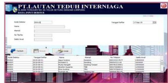
Gambar 5. Form Input Debitur

Form input debitur adalah tempat penginputan data-data nama debitur Dalam form input debitur admin dapat menginput kode debitur, nama, alamat, no telepon, serta saldo awal dbeitur setelah diinputkan admin dapat menghapus ,menambah, menyimpan dan smengubah, serta dapat mencetak kertas kerja yang dihasilkan oleh inputan debitur tersebut.