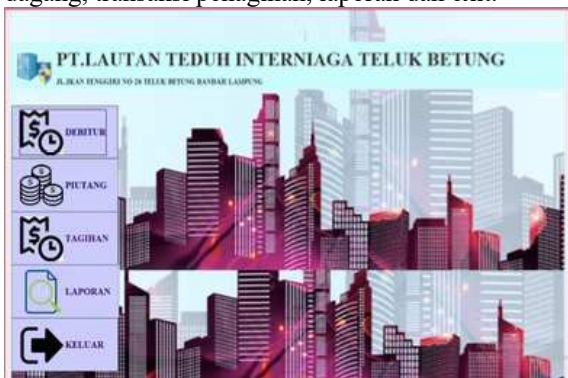
Gambar 4. Form Menu Utama

Menu utama merupakan sebuah halaman utama yang terdapat beberapa pilihan fitur yang dapat di jalani sesuai dengan keinginan admin ataupun sesuai dengan perintah pekerjaan yang harus dikerjakan. Didalam menu utama terdapat beberapa menu yang dapat di kelola oleh admin itu sendiri diantaranya fitur itu antaralain, Master Debitur, Transaksi piutang dagang, transaksi penagihan, laporan dan exit.