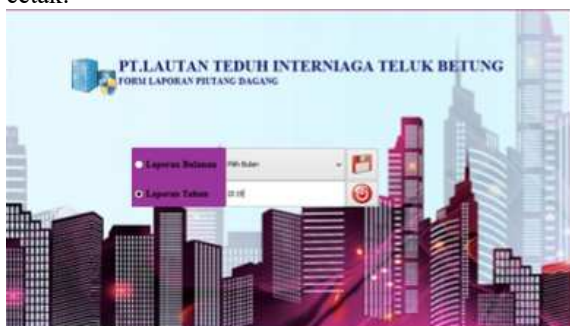
Gambar 9. Form laporan Per Tahun

Di dalam form laporan Per Tahun terdapat menu input , klik tahun yang di inginkan dan kemudian cetak.