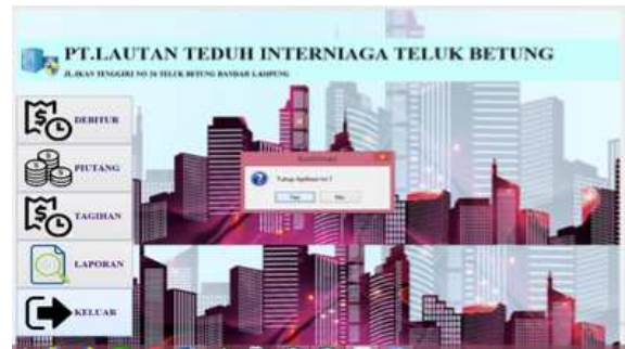
Gambar 10. Form Exit