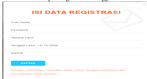
Gambar 6 Halaman Input Registrasi

Halaman register ditujukan untuk Registrasi. Halaman ini berfungsi agar pelanggan dapat memiliki username dan password yang bisa digunakan untuk login dan melakukan Pemesanan.