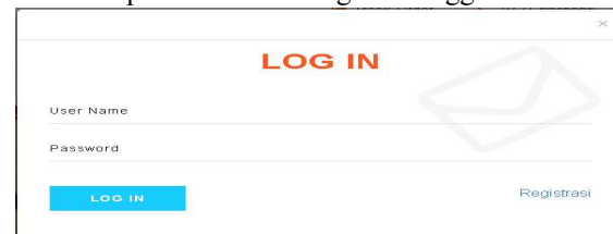
Gambar 7 Tampilan Login Pelanggan

Halaman Login adalah salah satu kunci untuk melakukan transaksi pemesanan pada toko PT.Penamart di Bandar Lampung.