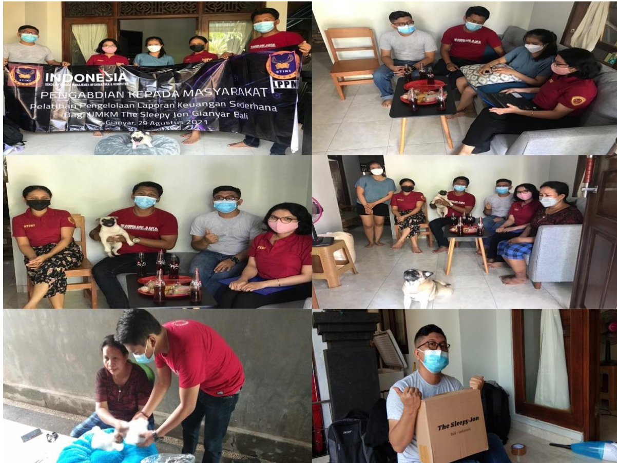
Gambar 2: Kegiatan Sosialisasi dan Pelatihan Laporan Keuangan Sederhana pada UMKM The Sleepy Jon Ketika Kegiatan Pelatihan dan Produksi

oleh 6 orang pegawai dari UMKM The Sleepy Jon. Berikut merupakan beberapa dokumentasi kegiatan pada sosialisasi dan pelatihan laporan keuangan sederhana yang dilaksanakan bersama dengan Mitra.