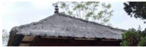
Gambar 6(a). Atap Bangunan

pada tiap-tiap bagian konstruksinya. Rangka atap terdiri dari kombinasi kayu gelam dan bambu. Atap terbuat dari seng dan ijuk serta berbentuk atap piramida. Keseluruhan atap berpusat pada kayu utama yang mencuat ke atas lazim disebut palak langik . Pada bagian bawah atap terdapat panggakh atau ruang yang berfungsi sebagai tempat penyimpanan barang pemanohan atau barang pusaka. Pada ujung atap terdapat ornamen yang terbuat dari susunan batu yang diikat disebut dengan culu langi . Ornamen tersebut menyimbolkan puncak Gunung Pesagi sebagai tempat roh leluhur berada.