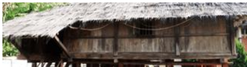
Gambar 7(a). Dinding Depan Bangunan

Pada bagian dinding bangunan Lamban Pesagi atau yang disebut dengan sesai terbuat dari papan kayu kemit yang disatukan disusun sejajar secara vertikal. Pada bagian dinding depan bangunan terdapat jendela-jendela atau singkepan kebik yang terbuat dari kayu serta pada sisi dinding lainnya terdapat ventilasi udara. Jendela pada dinding berfungsi sebagai lubang masuknya cahaya dan juga sebagai perantara sirkulasi udara yang juga didukung dengan adanya lubang ventilasi.