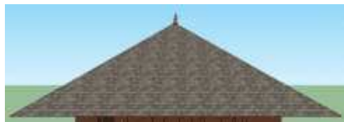
Gambar 6(b). 3D Model Atap Bangunan