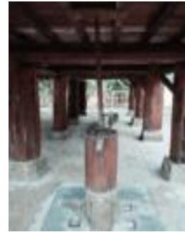
Gambar 10(b). Foto Iseran