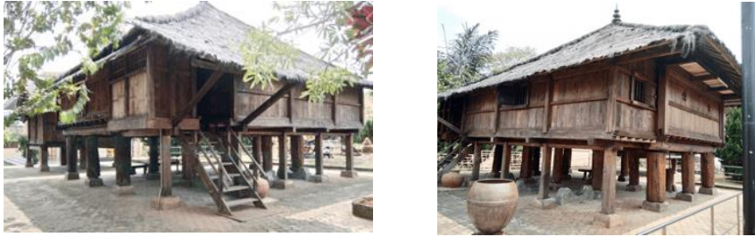
Gambar 2(c). Tampak Perspektif