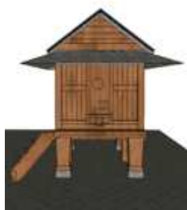
Gambar 10(a). 3D Model Lumbung Padi

Bangunan Lamban Pesagi biasanya dilengkapi dengan bangunan lumbung padi yang terpisah. Dikarenakan mayoritas masyarakat Lampung terdahulu memiliki profesi sebagai petani, maka masyarakat memerlukan penyimpanan padi yang cukup besar. Oleh karena itu, pada bangunan Lamban Pesagi terdapat lumbung padi yang terpisah dengan ukuran yang cukup besar berfungsi sebagai tempat penyimpanan padi atau hasil panen lainnya setelah masa panen.