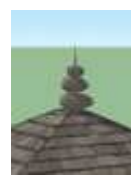
Gambar 6(c). 3D Model Culu Langi