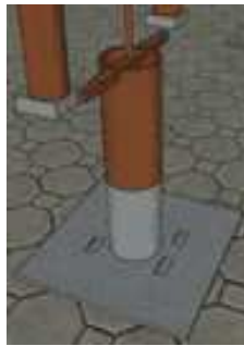
Gambar 10(a). 3D Model Iseran