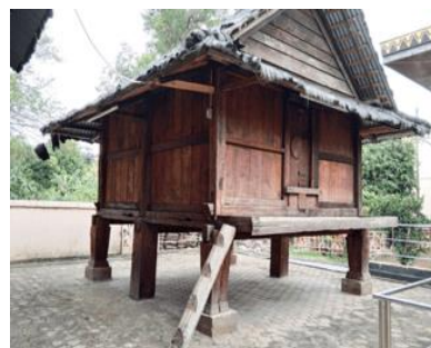
Gambar 10(b). Foto Lumbung Padi