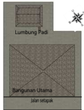
Gambar 1(a). Denah Tata Letak Bangunan