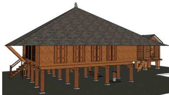
Gambar 3. 3D Model Perspektif (Sumber : Penulis, 2021)

Berikut terlampir hasil penggambaran ulang bangunan Lamban Pesagi dengan bentuk tiga dimensi model.