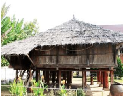
Gambar 2(a). Tampak Depan Lamban Pesagi

Berikut terlampir beberapa hasil dokumentasi penulis terhadap objek penelitian Lamban Pesagi yang berada di Museum Lampung.