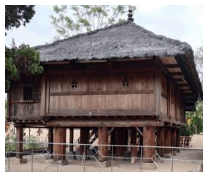
Gambar 2(b). Tampak Samping Lamban Pesagi