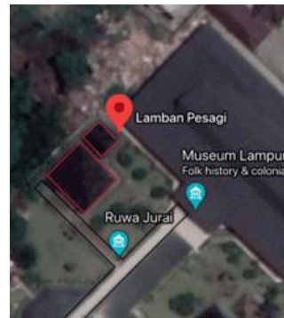
Gambar 1(b). Site Plan