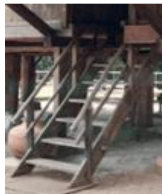
Gambar 9(a). 3D Model Tangga Gambar(b). Foto Tangga