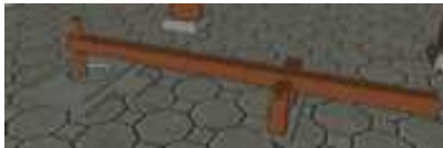
Gambar 10(a). 3D Model Girjoh

Girjoh merupakan alat yang digunakan untuk menumbuk padi atau buah kopi. Alat penumbuk ini terbuat dari balok kayu. Pada bagian ujungnya menyatu dengan alu yang tepat pada posisi lesung. Pada bagian pangkalnya dipasang sumbu untuk mengunci alok. Alat ini merupakan alat tradisional yang dalam mengoperasikannya masih menggunakan tenaga manusia.