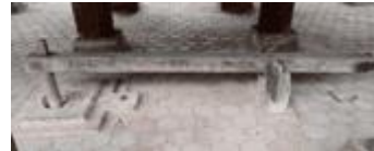
Gambar 10(b).