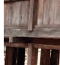
Gambar 8(c). Uwongan