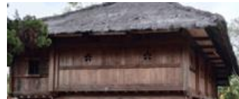
Gambar 7(b). Dinding Samping Bangunan