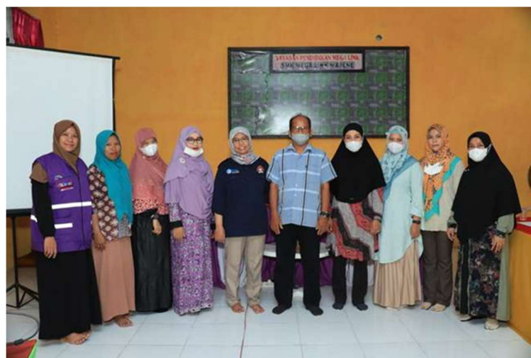
Gambar 1. Peserta pelatihan microsoft office excel

Kata kunci: guru matematika, media pembelajaran, microsoft office excel, statistika