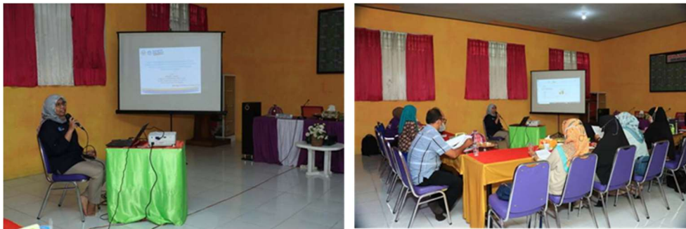
Gambar 3. Pelatihan penggunaan excel pada materi statistika

Materi pelatihan meliputi pengenalan fungsi pada Excel, pengimputan data, membuat tabel, mengkonversi data tabel menjadi grafik, dan menghitung ukuran pemusatan data (mean, median, modus, variansi, standar deviasi). Kegiatan pelatihan dapat dilihat pada gambar 3.