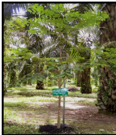
Gambar 2. Tanaman gaharu yang diaplikasi dengan arang pelepah kelapa sawit

Pemberian arang pada tanah dapat meningkatkan populasi mikroorganisme dalam tanah, yang berguna menunjang pertumbuhan dan perkembangan tanaman (Gusmallina, et al. , 2002). Arang pelepah sawit mengandung zat organik tinggi dan pH alkalis (basa) sehingga dengan aplikasi arang pada tanah yang bersifat masam dapat menetralkan pH tanah.