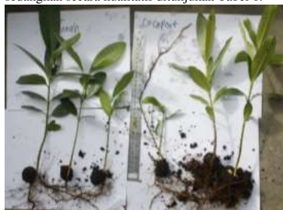
Gambar 1. Penampilan bibit dari media tanah (kiri) dan serabut kelapa (kanan)

Media semai merupakan komopenen utama dalam pembuatan tanaman. Media memiliki kandungan organik dan sifat fisika-kima yang berbeda – beda. Hal ini berpengaruh terhadap proses aerasi dan drainase, sehingga akan berpengaruh terhadap karakteristik pertumbuhan suatu tanaman. Pemilihan kedua jenis media yang dipakai dalam penelitian ini adalah dasar pemilihan media yang lebih mudah ditransportasikan, biaya dan efisiensi penyiraman dan pemupukan. Gambar 1 menunjukkan karakteristik bibit nyamplung dari 2 media, sedangkan secara kualitatif ditunjukkan Tabel 1.