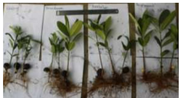
Gambar 2. Penampilan bibit dari perlakuan kontrol, perendaman, peretakan dan pengupasan

Menurut Suryawan et al. (2014) untuk mendapatkan viabilitas benih nyamplung yang tinggi membutuhkan perusakan cangkang atau pengupasan. Hal ini agar air mampu mencapai benih. Perlakuan yang diberikan tentunya harus berhati-hati karena benih didalam bisa mengalami kerusakan. Berdasarkan hasil ujicoba 1, ujicoba ini menggunakan media cocopeat . Berikut kenampakan bibit nyamplung yang dihasilkan pada bulan ketiga berdasarkan penanganan benih (Gambar 2) dan hasil rekapitulasi analisis sidik ragam (Tabel 2).