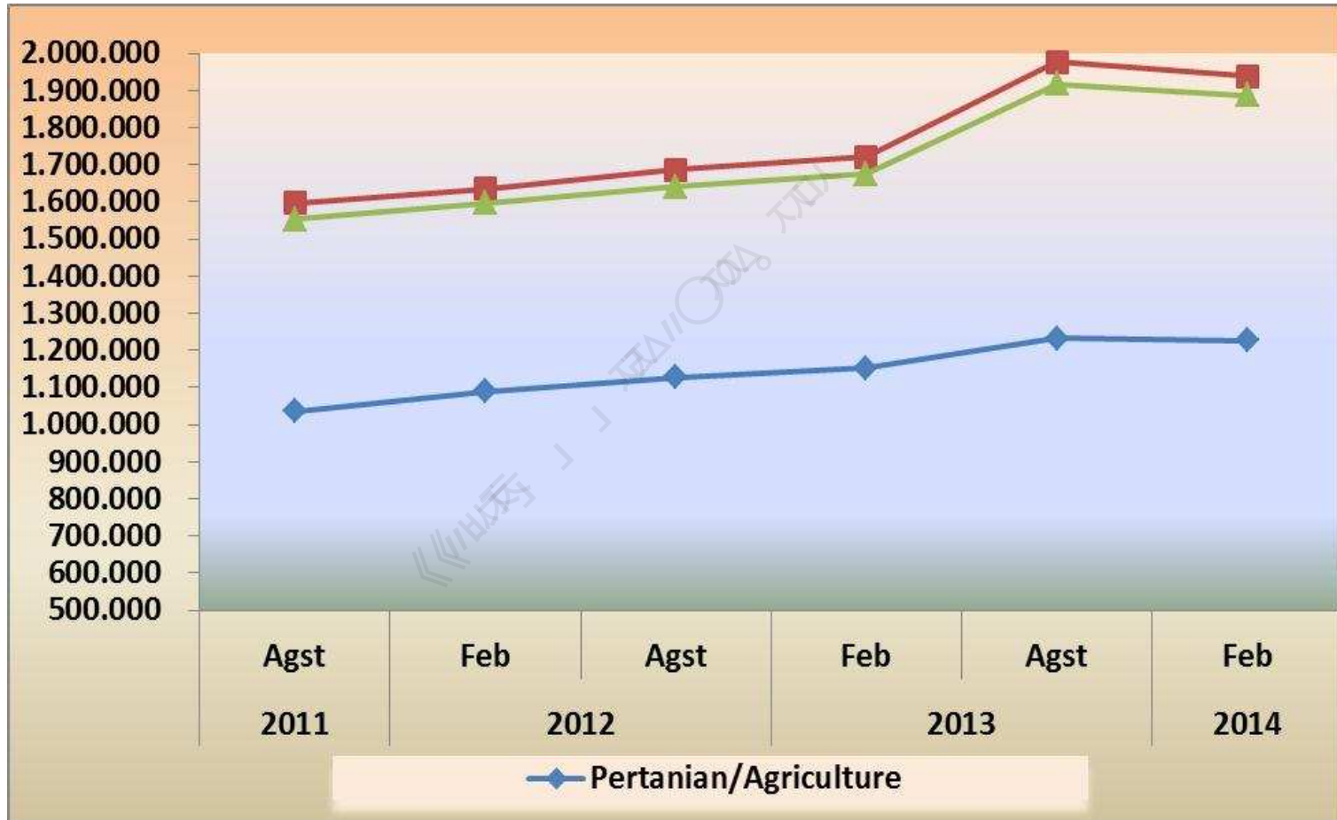
Rata-Rata Upah/Gaji Bersih (rupiah) Sebulan Buruh/Karyawan/Pegawai Menurut Lapangan Pekerjaan Utama Average of Net Wage/Salary (rupiah) per Month of Employee by Main Industry Triwulanan/Quarterly, 2011 – 2014