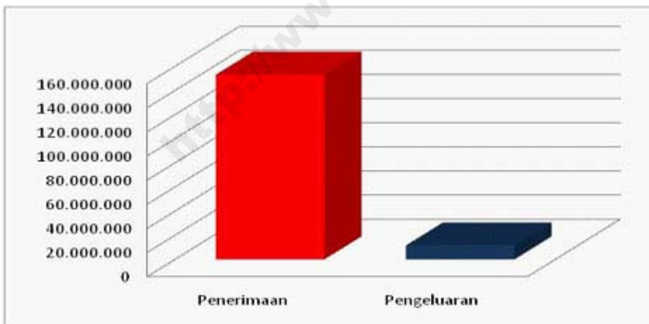
Gambar 2. Penerimaan dan Pengeluaran Perusahaan Peternakan Unggas