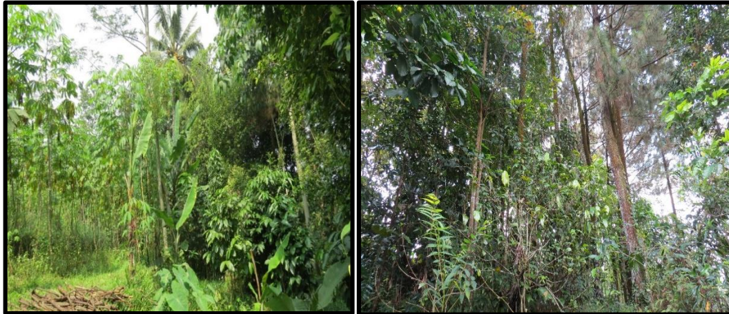
Gambar (Figure) 3. Pola tanam hutan rakyat luasan kecil ( The cropping pattern in small-scale private forest )

hanya bisa disisipkan sedikit tanaman buah-buahan sebagai tanaman tambahan saja dengan jarak tanam yang lebih lebar.