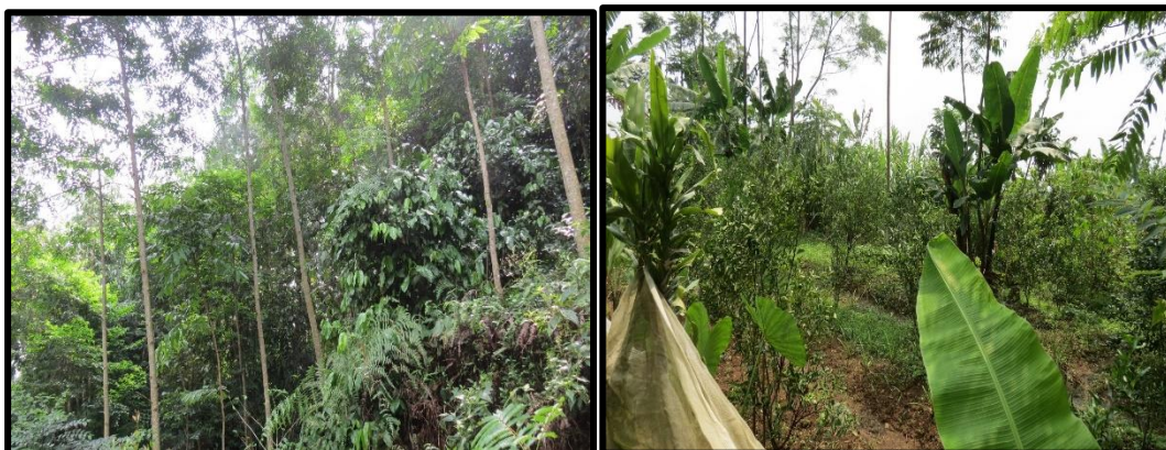
Gambar (Figure) 2. Pola tanam hutan rakyat luasan besar ( The cropping pattern in large-scale private forest )

Jenis tanaman berkayu (pohon) yang ditanam pada hutan rakyat pola 2, meliputi sengon ( P. falcataria ), kayu afrika ( M. eminii ), gmelina ( G. arborea ), jabon ( A. cadamba ), mindi ( M. azedarach ). Jarak tanam tanaman berkayu (pohon) yang digunakan adalah 3 m x 3 m. Jangka waktu panen untuk tanaman berkayu (pohon) sengon ( P. falcataria ), kayu afrika, gmelina ( G. Arborea ), jabon ( A. cadamba ), mindi ( M. azedarach ) selama 5-7 tahun. Jenis tanaman buah-buahan atau tanaman perkebunan yang ditanam pada hutan rakyat pola 2, meliputi pete ( P. speciosa ), duku ( L. domesticum ), rambutan ( N. lappaceum. ), nangka ( A. heterophyllus ), jeruk ( Citrus spp), jambu ( P. guajava ). Jarak tanam tanaman perkebunan yang digunakan bervariasi antara 4 m x 5 m sampai 10 m x 10 m. Jangka waktu panen tanaman perkebunan, yaitu 1 tahun untuk jambu dan lebih dari umur 5 tahun untuk jenis lainnya.