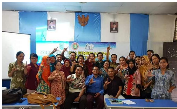
Gambar 3. Pemateri dan Peserta MGMP IPA Kabupaten Bengkayang

Setelah dilakukan penjelasan singkat tentang pembuatan naskah produksi media pembelajaran berbasis Macromedia flash , kegiatan selanjutnya adalah kegiatan pelatihan dan pendampingan sesuai dengan susunan materi yang telah direncanakan. Proses pelatihan berdasarkan susunan materi yang telah direncanakan bertujuan mengajarkan secara langsung tahap demi tahap proses penambahan berbagai macam media, baik itu teks, gambar, suara maupun video serta pembuatan animasi sederhana sesuai konsep IPA (Sains) baik Fisika maupun Biologi. Sedangkan untuk pembuatan soal evaluasi interaktif menggunakan software Easy Quizzy dilakukan pada hari kedua karena langkah dan metodenya lebih mudah dibandingkan mengajarkan pembuatan media menggunakan software macromedia flash .