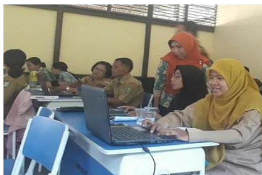
Gambar 2. Pemberian Materi Pembuatan Media Pembelajaran

Pemateri selanjutnya memberikan pelatihan dan pendampingan tentang pembuatan media pembelajaran sains interaktif menggunakan software macromedia flash dan pembuatan soal evaluasi interaktif menggunakan software Easy Quizzy . Proses pelatihan dimulai dengan penjelasan konsep pembuatan media pembelajaran berbasis macromedia flash , pembuatan naskah produksi media dan pengenalan lingkungan kerja aplikasi Macromedia flash .