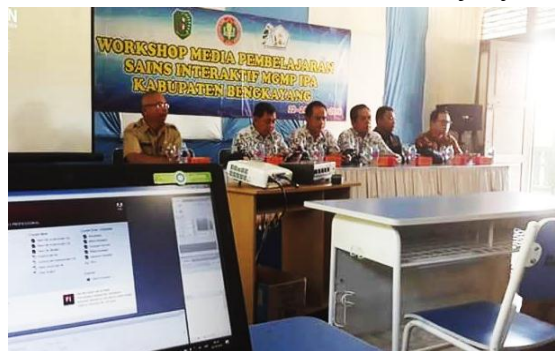
Gambar 1. Pembukaan Kegiatan Workshop Media Pembelajaran

Tahap pelaksanaan dilakukan sesuai dengan rencana kegiatan yang telah disusun. Pelaksanaan kegiatan dilakukan pada tanggal 22 sampai dengan 24 Oktober 2018 di SMPN 1 Teriak Kabupaten Bengkayang. Pembukaan acara dimulai pada pukul 08.00 oleh Dinas Pendidikan Kabupaten Bengkayang dan Ketua PGRI Provinsi Kalimantan Barat, kemudian dilakukan pembagian materi berupa handout yang nantinya akan digunakan dalam pelatihan dan pendampingan pembuatan media pembelajaran sains interaktif dan handout Easy Quizzy .