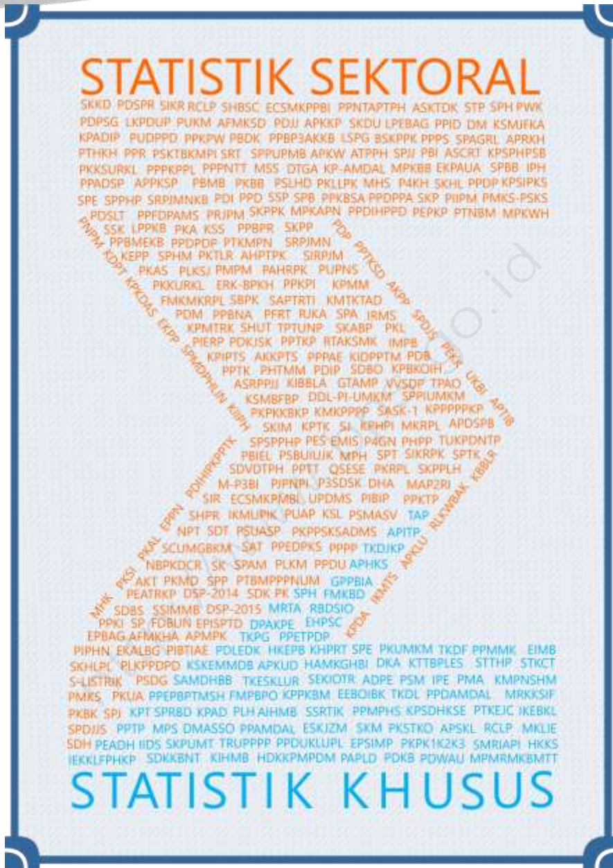
Gambar 1. Kata Kunci Kegiatan Statistik Sektoral dan Khusus